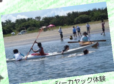
シーカヤック体験