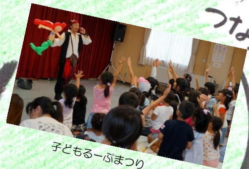
子ども一歩まつり