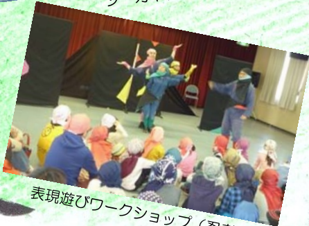
表現遊びワークショップ (忍者修行)