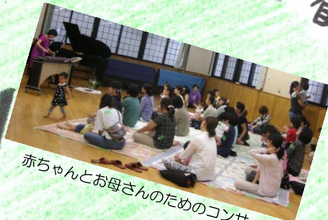
赤ちゃんとお母さんのためのコンサート