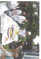
ガーデン・サーティ