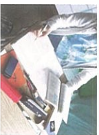
高校レポート指導

皇桂国際高等学校と連携し CCV で行う活動に参加することで卒業資格が取得できます。