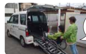
貸出用福祉車両と車椅子