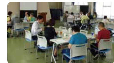
いずみさのオレンジカフェ