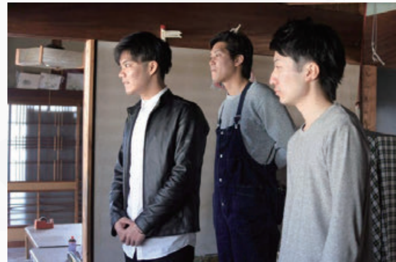
空き家視察の様子。紹介した2名が地域おこし協力隊の応募をした。