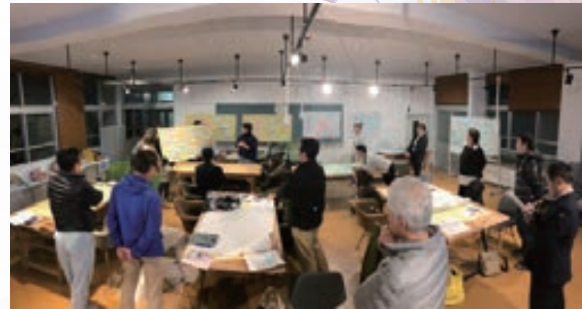
住民ワークショップ運営。多くの方に参加いただいた。