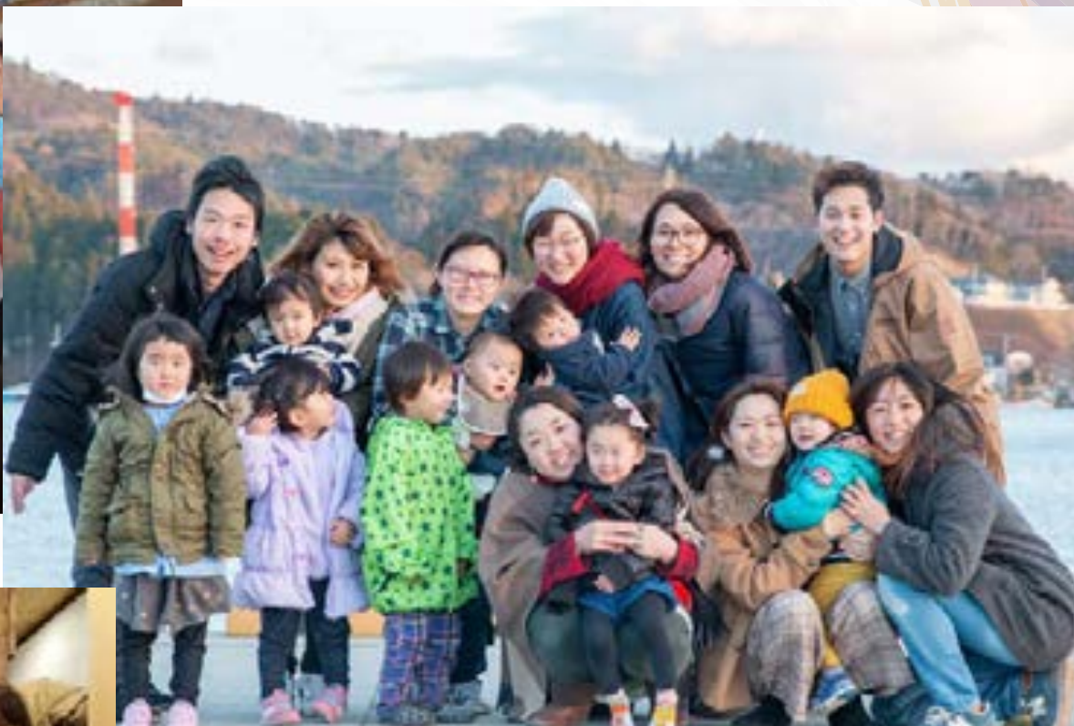
今年度の気仙沼のスタッフ集合写真。