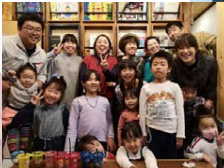
今後の絵本カフェの独立に全員が意欲的である。