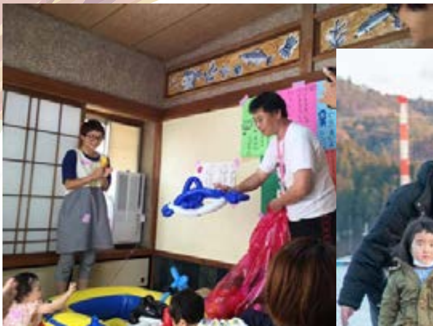
絵本カフェではイベントを積極的に開催した。