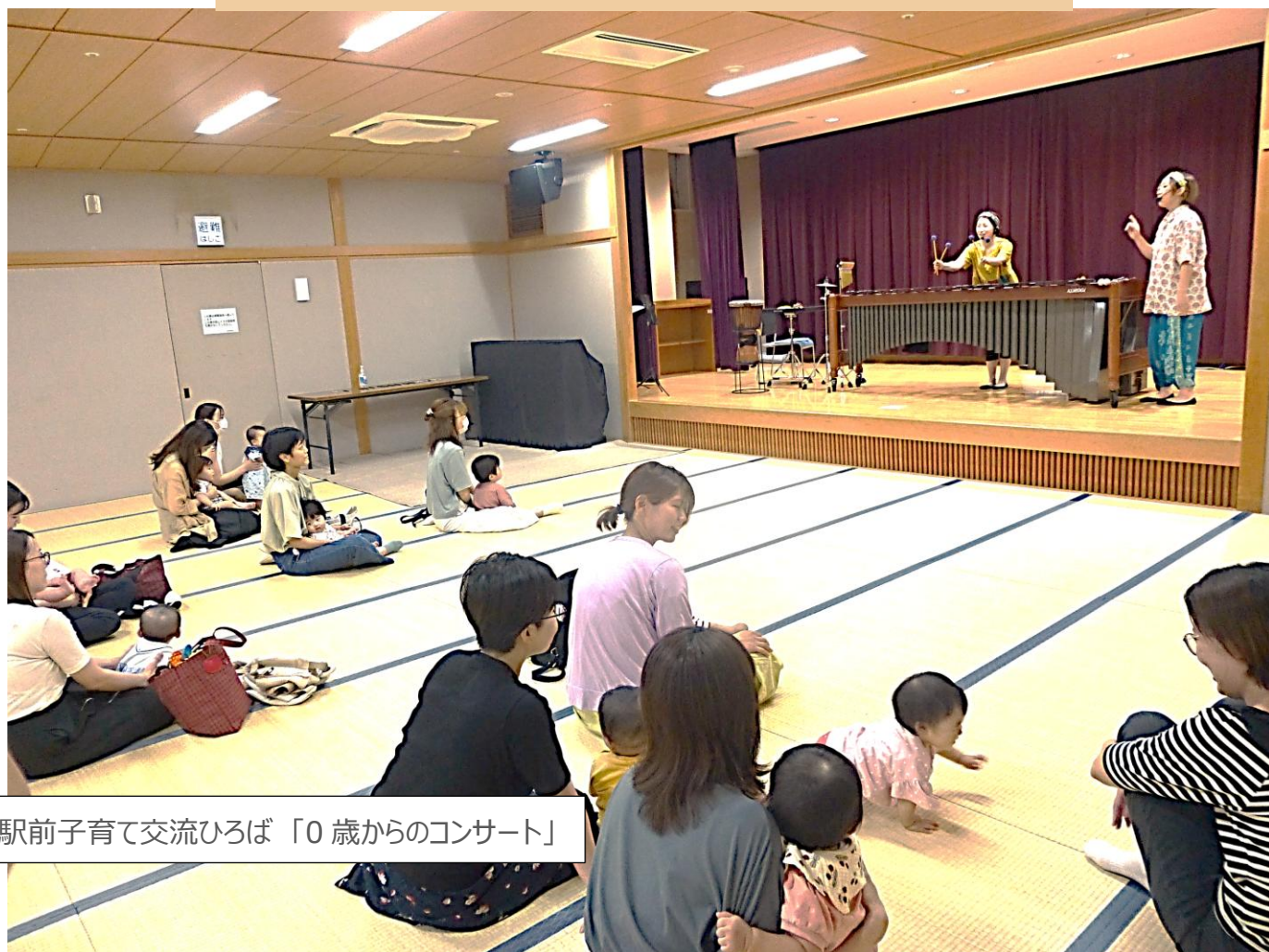
駅前子育て交流ひろば「0歳からのコンサート」