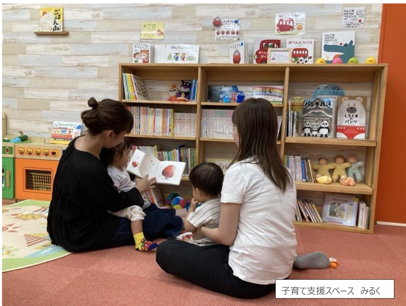
子育て支援スペース みらく