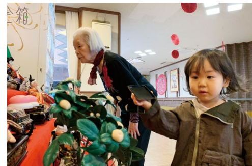
子連れでの勤務も可能に 皆を和ませてくれる存在です