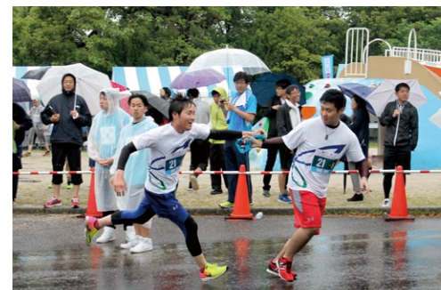
さわやかリレーマラソンに 参加したマラソン部