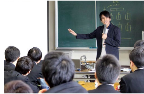
名古屋市工業高校で開かれた 認知症サポーター養成講座

さまざまなライフスタイルに合わせた働き方を推奨しています。託児スペースを設け、子連れでの出勤も可能となりました。サークル活動も盛んで、マラソン部やバレーボール、卓球部も始動。法人の援助のもと施設間を超えたチームワークが生まれています。