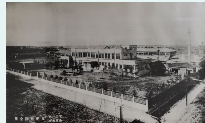
昭和8年設立 共愛病院