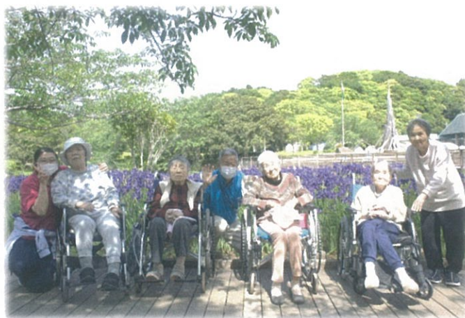
《袖ヶ浦公園外出行事》