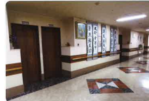
ケアハウス 廊下 (4F)