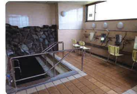
ケアハウス 浴室 (5F)