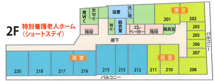
しまなみユニット