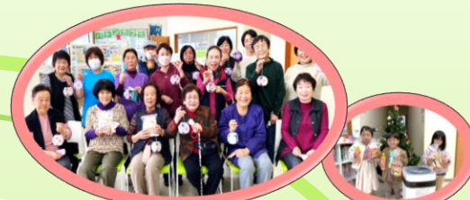
居場所づくり(バトンカフェ：兼子ども食堂)

バトンは、高齢者・障がい者・子どもたちはもちろん、だれもが男女差や年齢、収入差や国籍などにかかわらず、尊厳が守られ住み慣れた地域で、自分らしく笑顔で幸せに暮らすことが出来るよう権利擁護支援を行う団体です。