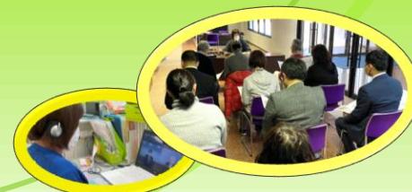
人づくり(市民後見人の養成・支援者のための勉強会)