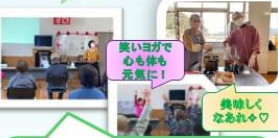
笑いヨガで 心も体も 元気に!

第10回バトンカフェ in 津久見 は令和4年3月21日(月) に開催しました。