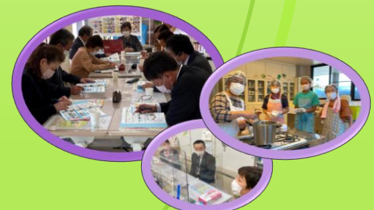
人づくり(視察・研修・ボランティアの受入れ)

認定 特定非営利活動法人 おおいた成年後見権利擁護支援センター (認定 NPO法人バトン)