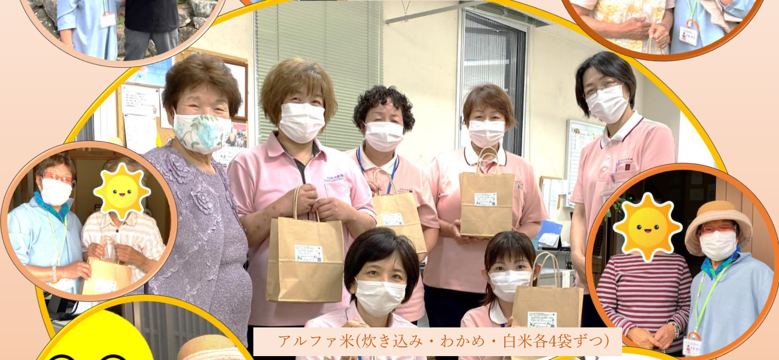
アルファ米(炊き込み・わかめ・白米各4袋ずつ)