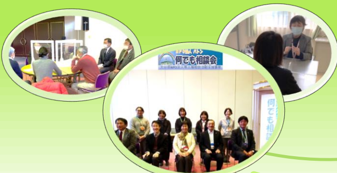
相談活動(何でも相談会・相談ブース)