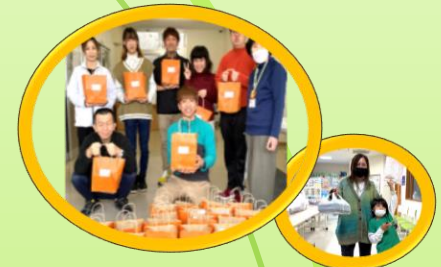
地域支援活動(おたがいさま事業)

バトンは、高齢者・障がい者・子どもたちはもちろん、だれもが男女差や年齢、収入差や国籍などにかかわらず、尊厳が守られ住み慣れた地域で、自分らしく笑顔で幸せに暮らすことが出来るよう権利擁護支援を行う団体です。