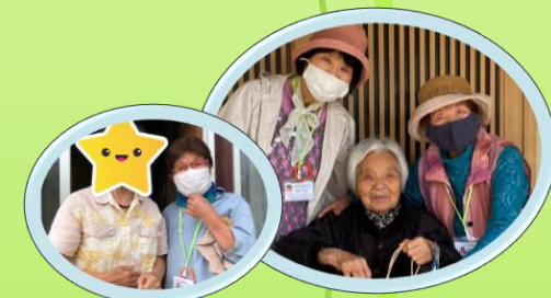
地域支援活動(地域見守りたい事業)

認定 特定非営利活動法人 おおいた成年後見権利擁護支援センター (認定 NPO法人バトン)