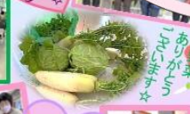
お誕生日 おめでとう ございます ☆