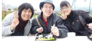
ボランティアのみなさん、 ありがとうございました。