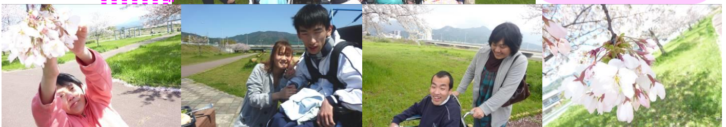
昼食のメニューをお弁当箱につめて、桜を見ながらいただきました (*^O^*)

3/29・30・31, 4/2・5・6・8 今年も東温市の横河原公園で お花見をしてきました。 (^O^) まだまだ風が冷たくて、 寒い日もありましたが、 今年は、昨年比べて花の 散るのが遅かったので、 長い間、桜を楽しめました。 (*^。^*)