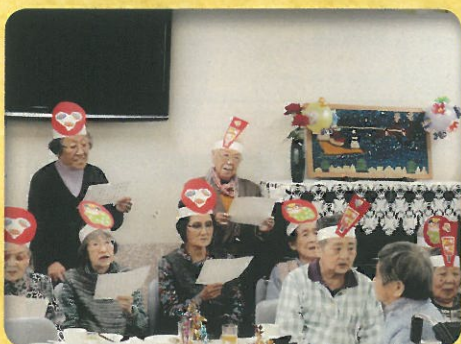
つちやホームクリスマス会