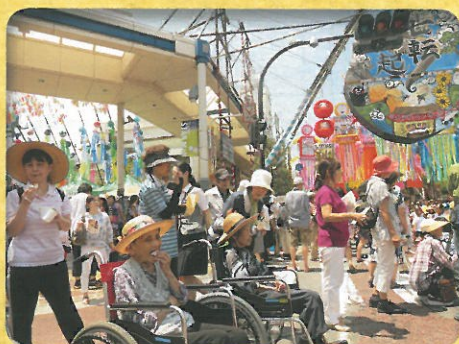
ローズヒル七夕見学