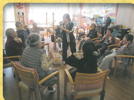
デイサービス健康体操