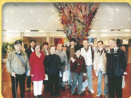
つちやホーム日帰り旅行