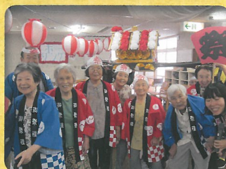
デイサービス夏祭り