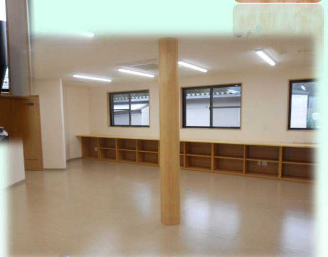
平成28年4月1日「工房きずな」増築