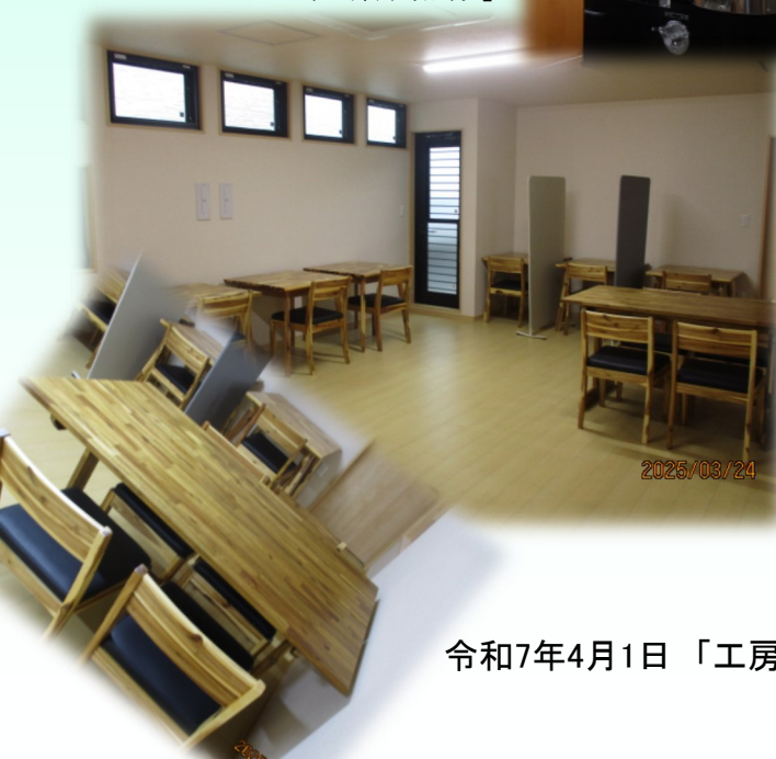
令和7年4月1日「工房きずな」増築