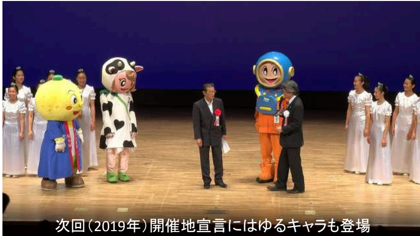
次回(2019年)開催地宣言にはゆるキャラも登場

きぼうの桜サミット共同宣言 ♡ 私たちは、大災害の記憶と教訓を千年先まで伝える未来遺産として、きぼうの桜を守り育てていきます。 ♡ 私たちは、地球市民として、この星のいのちの美しさを体感しつつ、交流の継を地球規模に広げていきます。 ♡ 私たちは、大災害からの復興における世界中からの支援に感謝を表すための宇宙ミッションの実現を目指します。