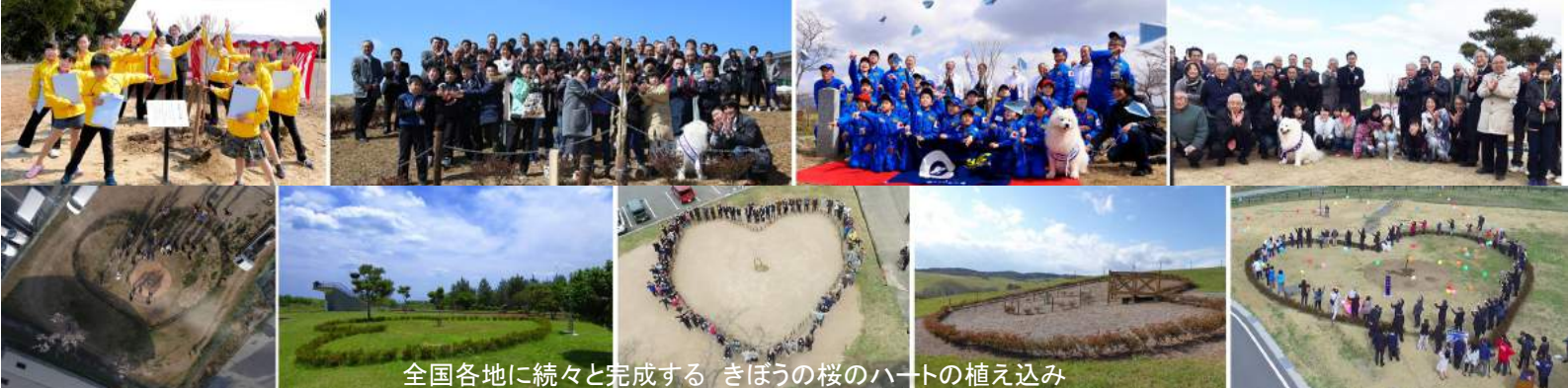
全国各地に続々と完成する きぼうの桜のハートの植え込み