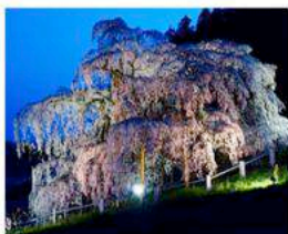
三春滝桜 福島県三春町 推定樹齢1000年