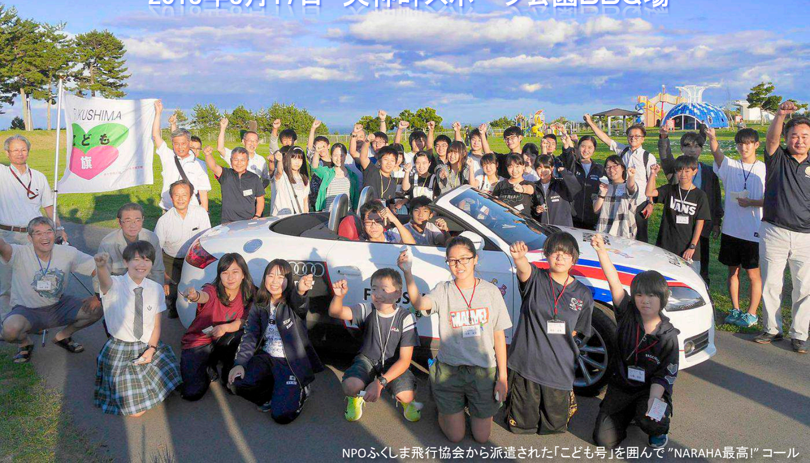
NPOふくしま飛行協会から派遣された「こども号」を囲んで「NARAH最高!」コール