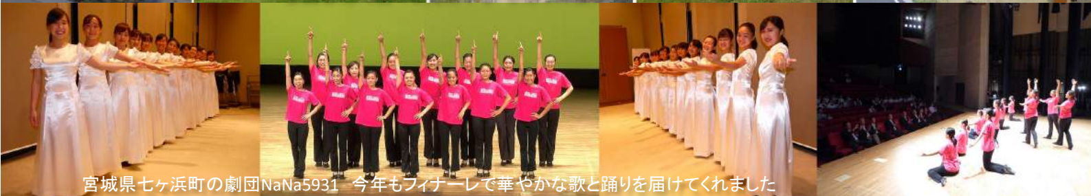
宮城県七ヶ浜町の劇団NaNa5931 今年もフィナーレで華やかな歌と踊りを届けてくれました