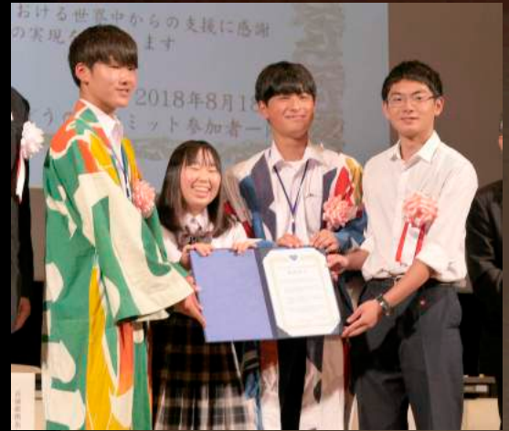
パネルに登壇した中高生代表4人 きぼうの桜サミット共同宣言を発表してくれました