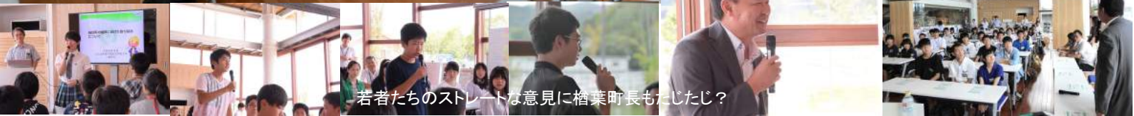
若者たちのストレートな意見に榎葉町長もたじたじ？