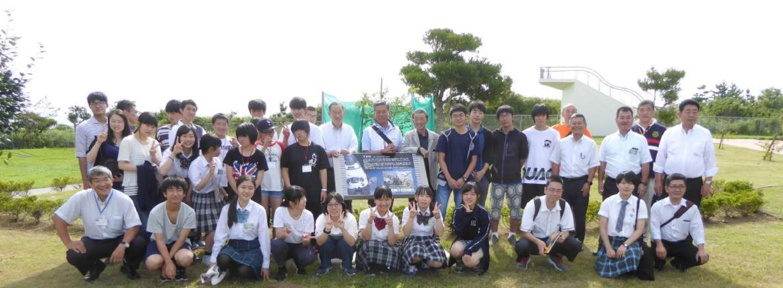
天神岬の「きぼうの桜」の前で