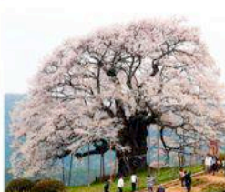
醍醐桜 岡山県真庭市 推定樹齢1000年 伝・後醍醐天皇御鑑賞