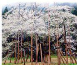
根尾谷淡墨桜 岐阜県本巣市 推定樹齢1500年 御手植・継体天皇