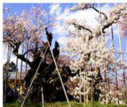
山高神代桜 山梨県北杜市 推定樹齢2000年 御手植・日本武尊