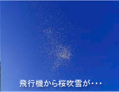
飛行機から桜吹雪が...