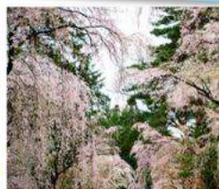
角館武家屋敷桜 秋田県仙北市 推定樹齢300年超