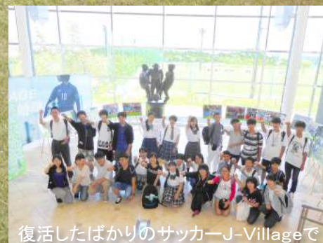
復活したばかりのサッカーJ-Villageで