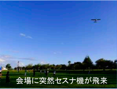
会場に突然セスナ機が飛来