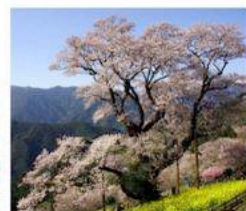
ひょうたん桜 高知県仁淀川町 推定樹齢500年 一説・武田勝頼植