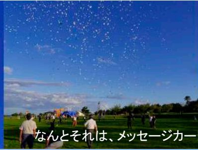
なんとそれは、メッセージカード → 協力・NPOふくしま飛行協会