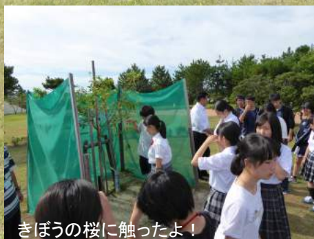
きぼうの桜に触ったよ！