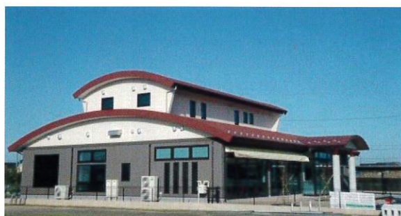
ベーカリーたんぽぽ外観