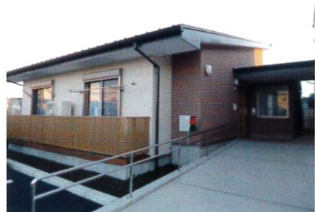
クローバー（男性棟）