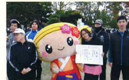
虫駅伝大会宣言タイムで準優勝!