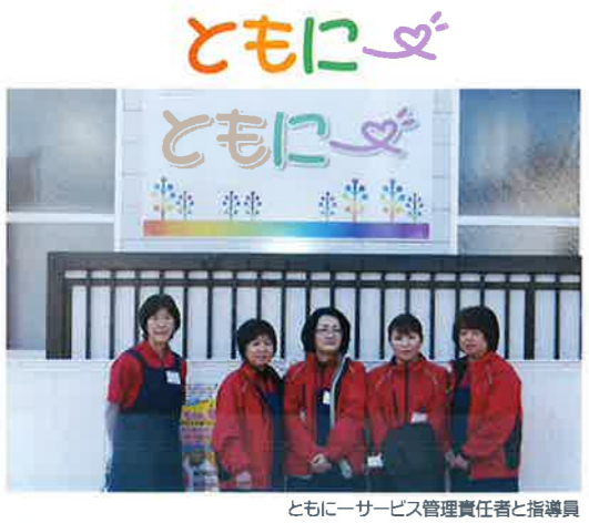
ともに一サービス管理責任者と指導員

お問合せは 特定非営利活動法人茨城自立支援センター TEL 029-291-4154 FAX 029-291-3201