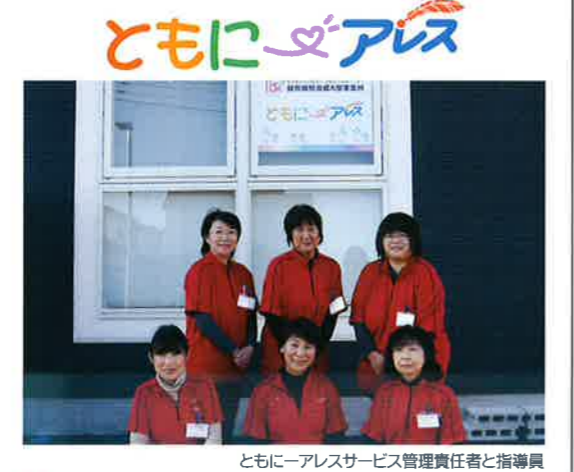
ともにアレスサービス管理責任者と指導員