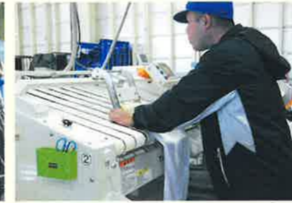
クリーニングタオルたたみ