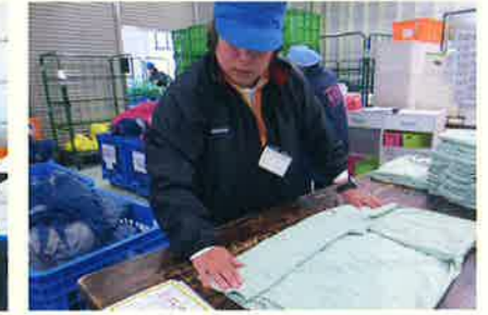
私物リース着たたみ