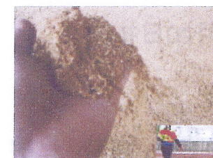
割り箸が砕かれ 紙の原料に