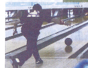
スポーツ大会 への参加