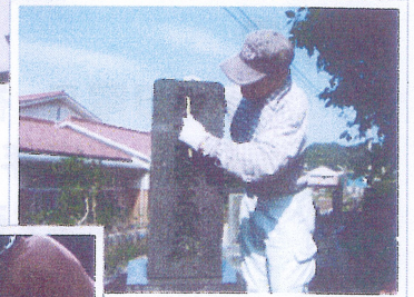
お墓の掃除 草刈り