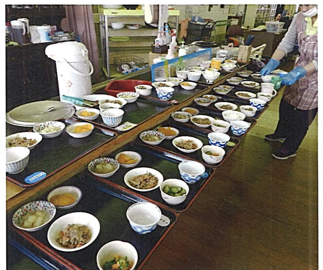
温かい状態で栄養バランスのとれた食事を提供