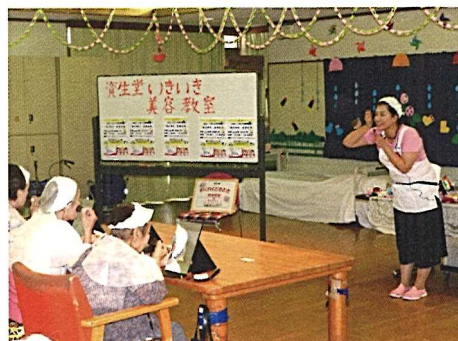
年3回 いきいき 美容教室を開催