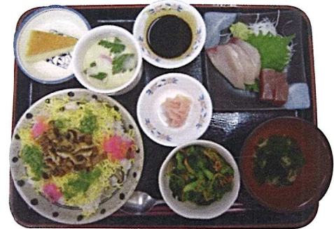
誕生日会 メニューの 一例