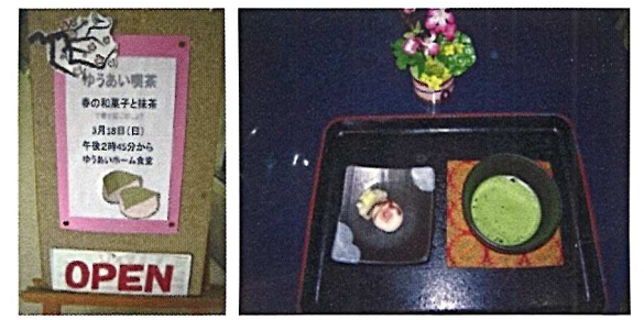
ゆうあい喫茶の一例