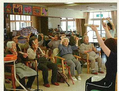
リズム体操など楽しい遊びを通して運動機能を向上させます