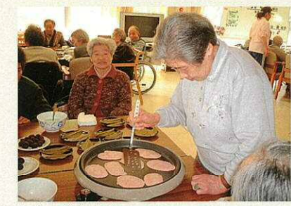
おやつ作りも楽しみの一つ