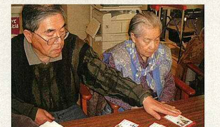
カルタとりなど地域の方とのコミュニケーションが図れます