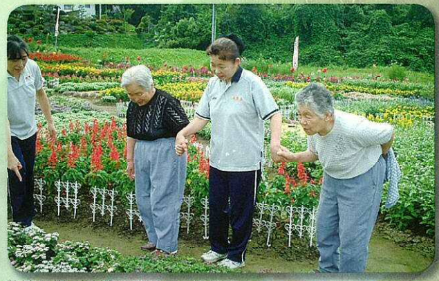
花壇見学/地域のみどころを拝見