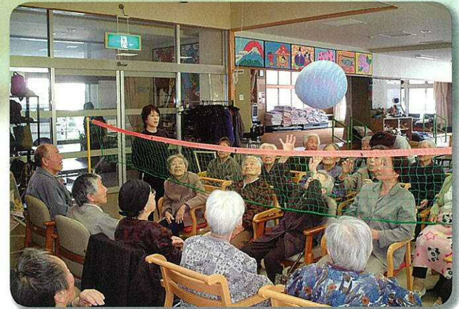
風船バレー/楽しく一日を過ごすレクリエーションがいっぱい