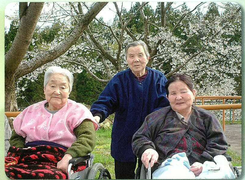
お花見/秋は紅葉狩りなど季節を味わう遠足があります