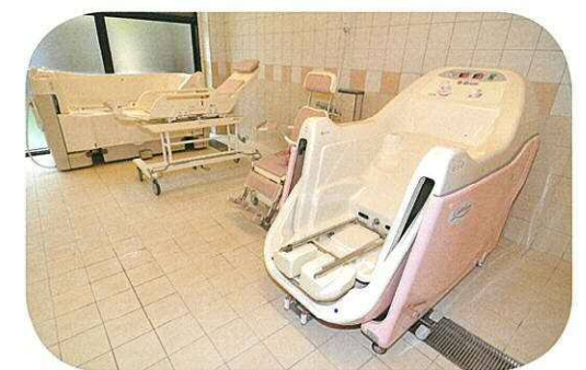
座式入浴設備・仰臥式入浴設備