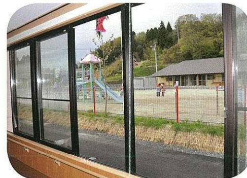
廊下より保育園をのぞむ