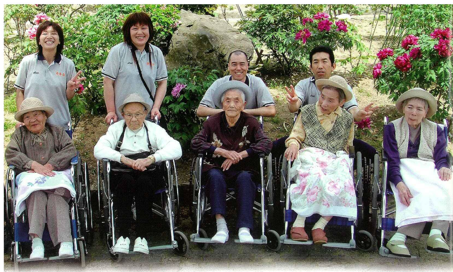
バスハイク・ポタン園