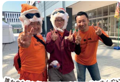
いつか 誰かのために何かをできる青年へ 共に歩んでいきます