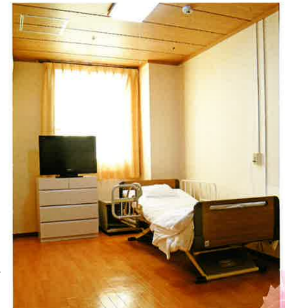
明るくて清潔な居室