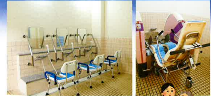
入浴介助専門スタッフがお世話します。