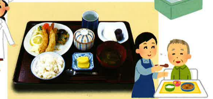
地元産の食材を使った、バランスのとれた美味しい食事