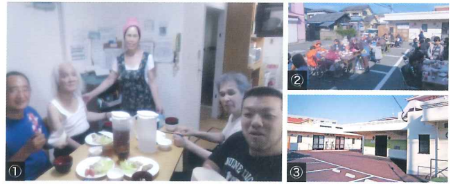
①家庭的な雰囲気の中で、皆で賑やかに食事（ホーム毎に様々なカラーがあります） ②つくしんぼまつり!! 地域の方もたくさん参加して頂きました ③バリアフリー環境のホーム