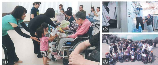
①地域の幼稚園児との交流を行っています。②B型の工賃は福岡でもトップクラス。③一泊旅行や日帰り旅行を行っています。

自宅介護を行なっている方が病気などの理由により介護を行うことができない場合に、短期間入所して必要な介護(入浴、排せつ、食事等)を行います。