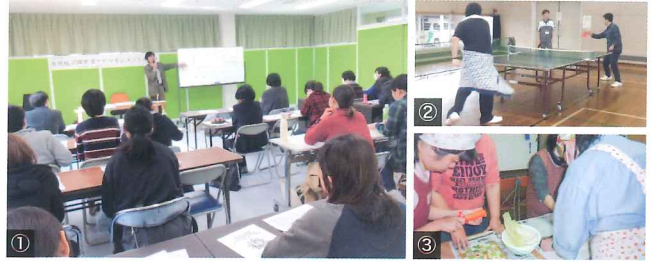
①有明地区障害者マネジメント研修に参加し、スキルアップを目指します。 ② I型利用者の皆さんと卓球交流会<サンアビ> ③雑煮作り

障がいのある方にも気軽にパソコンに触れていただきたいという思いで、ハーツでパソコン教室を開催しています。定員を4名とし、基本的な操作からインターネット・メールの操作まで初級(12回)、中級(6回)の2コースに分けて実施しています。