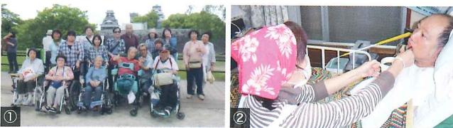
①レクリエーションで熊本城へ ②自宅での食事介助

ご自宅にホームヘルパーを派遣して、家事援助、身体介護等の支援を行います。一人では外出することが困難な方に付き添い、外出の支援を行います。