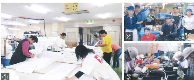
①タオルの縫製。繁忙期は1日1万2000枚加工! ②施設外就労(取引企業にて自動車部品の塗装) ③施設外就労(取引企業にて解体作業)