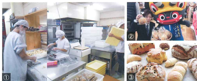
①スタッフみんなで愛情を込めて作っています。 ②大人気!! ちょっと昔なつかしいジャー坊のメロンパン! ③噛めば噛むほど、味わいが増していく天然酵母パン。