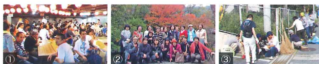
①毎年7月に夏まつりを開催。老若男女200名以上集まる平原校区の一大イベント。②バスハイクで紅葉を観に♪ ③地域の方々と協力して清掃活動。

地域の方々へ、地域交流センターや多目的室の無料貸し出しを行っています。カラオケ教室やペン習字、将棋愛好会など、利用者自身が運営したりと、皆さんいきいきと活動されています。