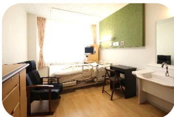
落ち着いた療養環境の個室

急性疾患等の治療、及びリハビリテーションを行います。患者様の早期回復を目的とし、医師、看護師を中心とした多職種により、治療、看護、リハビリを行います。特に理学療法士・作業療法士・言語聴覚士によるリハビリの体制を強化しています。