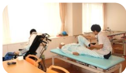
機能訓練室でのリハビリ