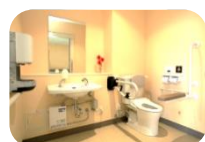
明るく広い個室で、ご家庭のようにリラックスしていただけるよう整えています。