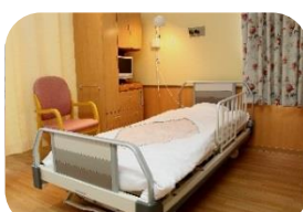
個室と多床室を完備しています