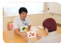
言語聴覚療法場面