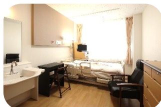
プライバシーに配慮した個室

脳血管疾患、骨折手術後などリハビリテーションを必要とする方を対象に急性期治療後早期から集中的なリハビリを実施します。理学療法士・作業療法士・言語聴覚士による365日（土曜、日曜、祝日含む）1日2～3時間のリハビリ提供体制を整えています。