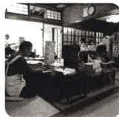
就労継続B型 箱折り作業