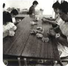
就労継続A型 つぼみボンボン作り