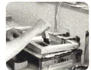
就労継続B型 シルクスクリーン印刷

シルクスクリーン印刷(企業より受託)、アルミ缶回収簡易作業の他、食品の自主製品開発等を行っています。