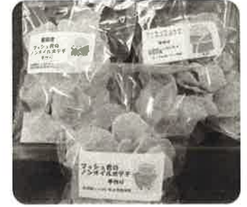
就労継続B型 ポテトチップス製造