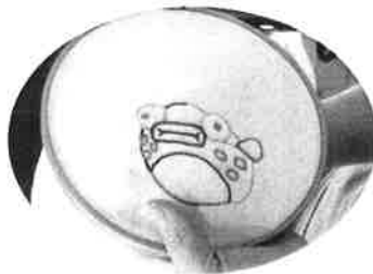
生活介護: 手芸作業

パン・製菓・木工・手芸・陶芸などの多様な作業に取り組みながら地域の一員としての自立と社会参加の促進を図ります。