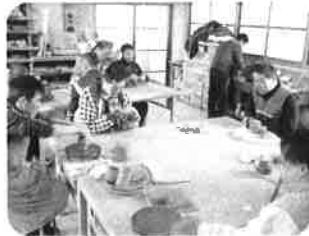
生活介護: 陶芸製造