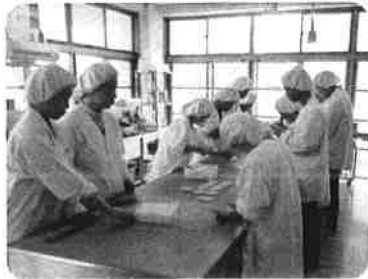
就労継続B型 パン製造