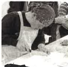
サークル活動(調理)

アート活動(PEECE PLANT)を中心にハーブ石けん作り簡易作業を行っています。