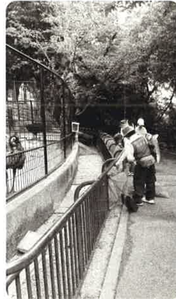
就労継続A型 動物園清掃