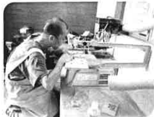
生活介護: 木工作業