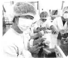
就労継続B型 焼き菓子製造