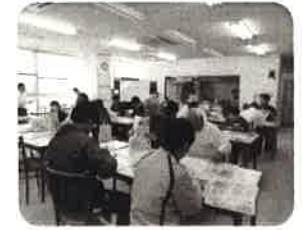
就労継続B型 簡易作業