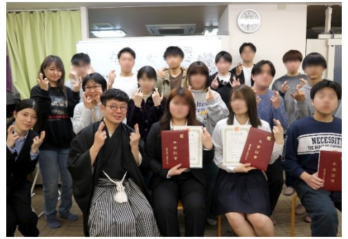
3月に行った卒業式