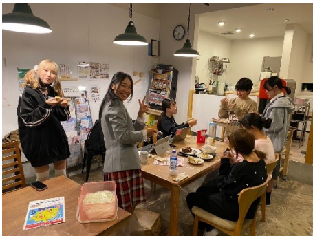
定例ミーティングの様子

2018年1月に設立した#おかやまJKnoteは6期目となり、毎週1回の定例ミーティングも2024年2月に300回を迎えました。奉還町土曜夜市への出店、8月に、芝浦工業大学・YKG60（矢掛町）との合同合宿を行いました。また、10月以降、ユースセンター内カフェで定例の「JKカフェ」を開催しました。