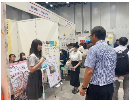
SDGsフェアに出店した金光学園高校

高校生の探究活動の実践フィールドとして奉還町ユースセンターを活用してもらいました。主なものとして、金光学園高校のSDGsアイス、瀬戸南高校「まるたま」による玉子コロッケ、方谷学舎高校によるいのししラーメンはそれぞれテレビや新聞で取り上げられるほどの反響を得ました。