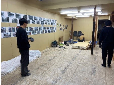
DIYで床のカーペット貼りを