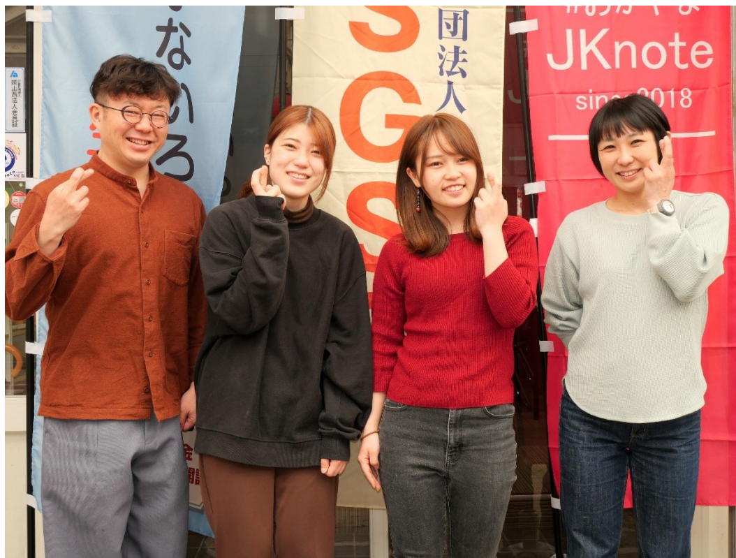
2023年度常勤スタッフ

青少年健全育成活動の講演会講師派遣の事業を岡山県より委託され、84件の講演会等をマッチングしました。