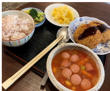
栄養バランスを考えて提供しました