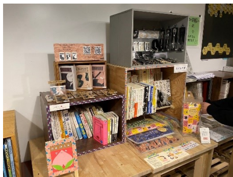
個性あふれる出店者の棚