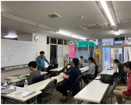
教室での学習活動の様子

2023年4月にオープンした通信制サポート校。連携先は鹿島朝日高校。授業は午後開始、週1日～3日の登校が選べ、自分のペースで高校卒業資格を得られます。2023年度は4名の卒業生を送り出しました。