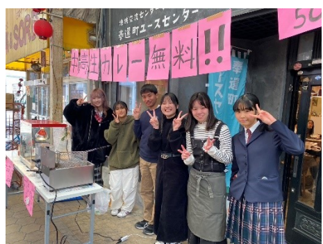
中高生が提供するユース食堂