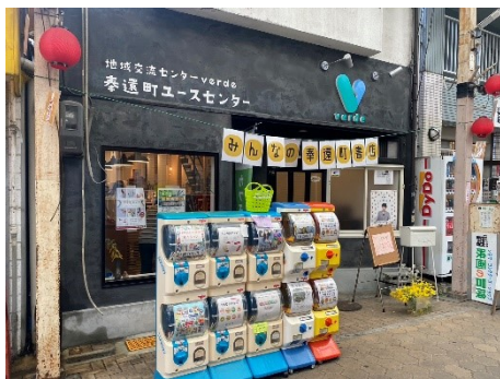
書店イベント時の会場外観

2024年3月9日～30日の間、地域交流ステーションベルデ1階にて、シェア型書店イベント「みんなの奉還町書店」を開催しました。38人が「ひと箱出店」し、207人のお客様にお買い上げいただき、売り上げ総額は22万円を超えました。