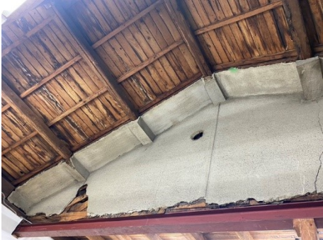
修繕前の痛んだ天井部分

奉還町ユースセンター2期工事として、2階壁および天井の修繕、床のカーペット貼りを行いました。そのための資金調達として、2023年10月～11月にREADYFORによるクラウドファンディング立ち上げ、110万円のご支援いただきました。