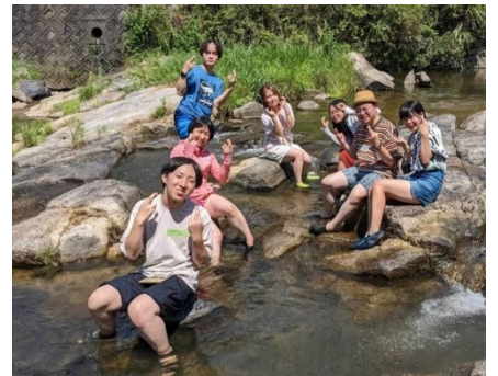
矢掛町での夏合同合宿