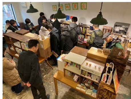
たくさんのお客様で賑わいました