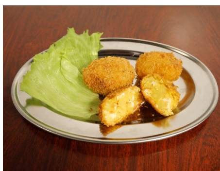
瀬戸南高校の玉子コロッケ