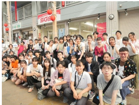
奉還町土曜夜市に参加した高校生