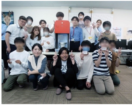
外部講師を招いた特別活動