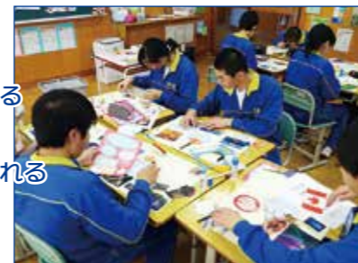
いつの間にか真剣に夢と向き合っています