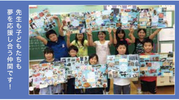
先生も子どもたちも夢を応援し合う仲間です！

ドリームマップは「夢への地図」 今の自分に向き合い現在地を知る。 自分の中から湧き上がる「こうなったら幸せ」「これをやってみよう」という目的地を描く。 夢に向かって行動したくなるスイッチ ON、自ら道を探し、今日できることから歩み出す。 夢を描くコツ、夢をかなえるコツを知り、幸せな人生を主体的に選ぶきっかけを届ける授業です。