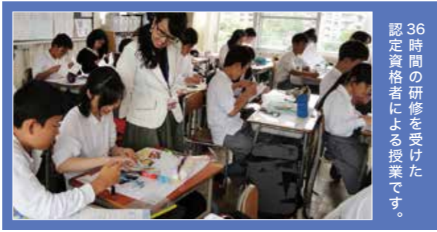
36時間の研修を受けた認定資格者による授業です。