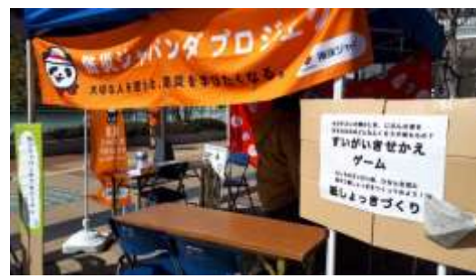
SAVE JAPAN プロジェクト (フィールドプログラム：10/28(土)、11/5(日)、マルシェ 3/10(日))