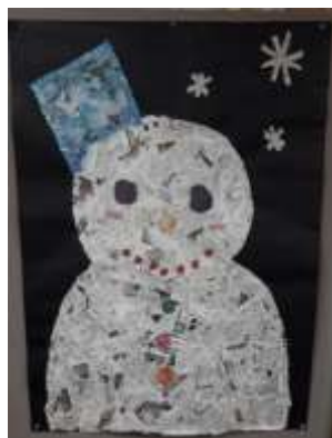
施設の飾りつけボランティア