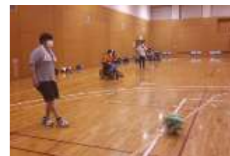
電動車いすサッカーボランティア