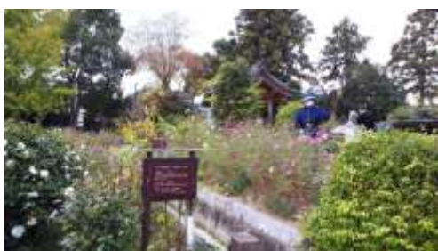
コスモス育成ボランティア