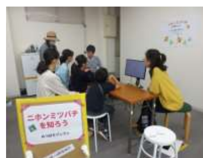
暮らしのブンカサイ in いこま (11/5(日))