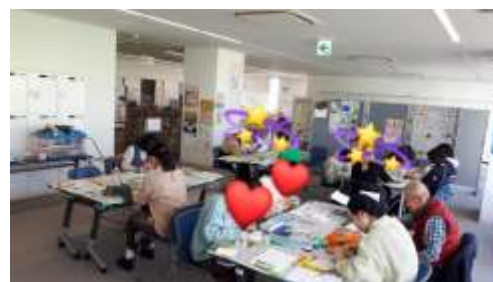
お手紙作成ボランティア in 橿原