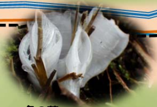
冬の華 シモバシラ

冬：寒い朝にはシモバシラの花が見られます。 春を待つ植物の冬芽や、秋に葉が落ちた痕（葉痕：ようこん） がおさるや ヒツジ 等のいろんな顔に見えてくる。 どんな顔があるか探してみよう！