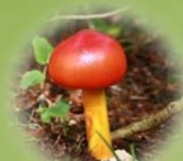
真っ赤な タモコタケ