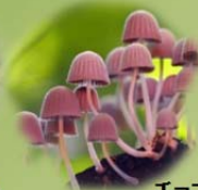
チョコのような イヌセンボンタケ