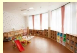
幸町・子育てリラックス館▶

「千葉市 子育てリラックス館・園生出張ひろば」 幸町の出張型リラックス館として本部施設内で実施しています。 【毎週金 10～16時】