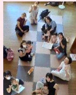
▲八街「子育てサロン」