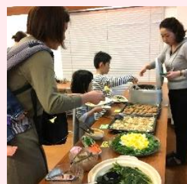
▲千葉「みんなのテーブル」