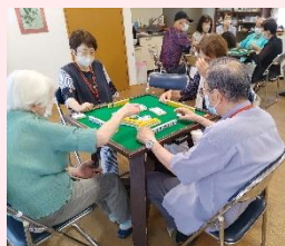
▲千葉・柏「健康麻雀教室」

講座やイベントの開催を通じ、地域の人々が出会い、関係性を作ることで、地域での支え合いや新たな活動も創出します。 (場所)柏センター・千葉センター・八街センター