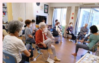
▲柏「光ヶ丘サロンよってって」

地域の人々の交流の場、併設する高齢者施設利用者や職員の憩いの場として運営。定期的に講座やサロン、年数回のライブやマルシェを実施しています。