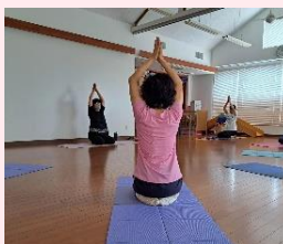
▲千葉「癒しのヨガ教室」