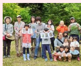
▲八街「自然とあそぼう」