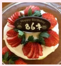
▲施設入居者への手づくりバースデーケーキ