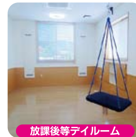
放課後等テイルーム