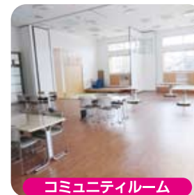
コミュニティールーム