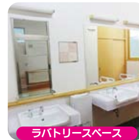
ラボトリースペース