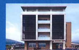
ユニット型特養 いぶき苑別館開設