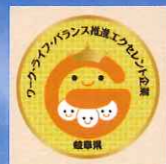
「岐阜県ワーク・ライフ・バランス 推進エクセレント企業」認定