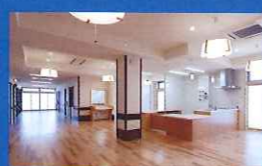
地域密着型特養 ほのほのいぶき開設