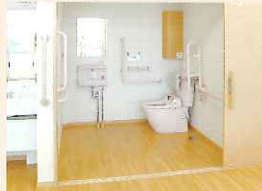
▲ 車椅子に対応、広々とした手すり付き