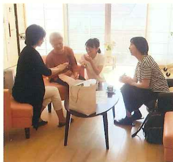
訪問されたご家族と楽しい語らい