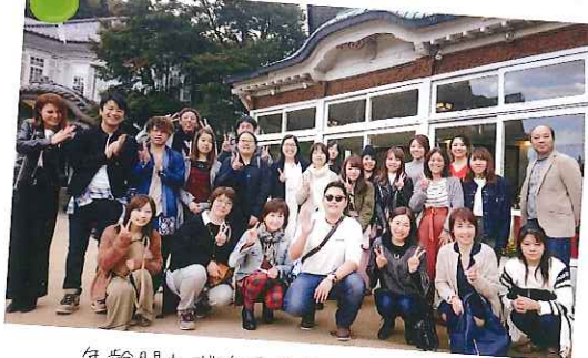
年齢問わず職員全員仲が良いです。 そんな仲間との旅行はホントに楽しい!!

そのたびに、全員が全力で取り組んで、笑いあり・感動ありのシーンが数多くあります!思い出がどんどん増えていき、楽しい時間を過ごせるのも当苑の魅力の1つですよ!