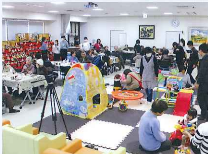
▲ 認知症カフェとおもちゃ図書館の開催