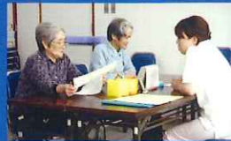
岐阜県のモデル事業として 学習療法開始