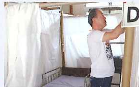
▲ 地震被災地への応援(福祉避難所の設置)