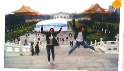
海外旅行で、リフレッシュ!!