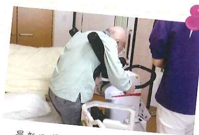
最新ロボット導入で介護員担軽減!

法人独自の育児休暇制度:配偶者の出産のための休暇2日間、育児参加の休暇5日間が特別休暇として有給で取得可能。