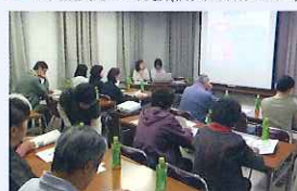
▲ 地域の方への出前講座