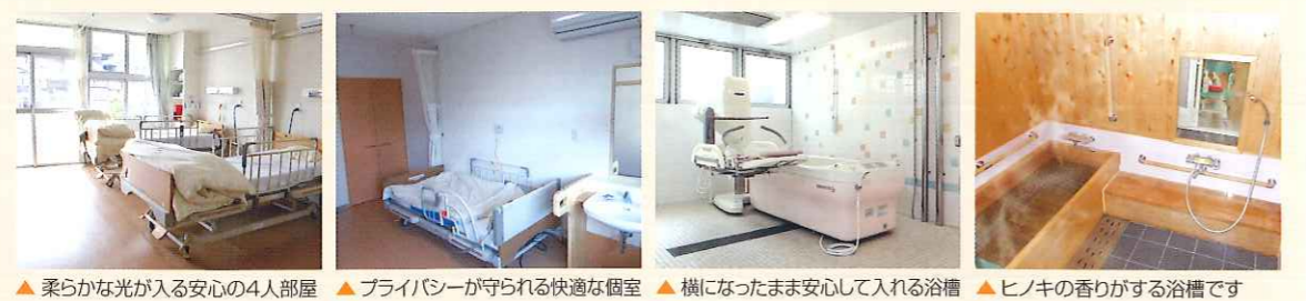
▲柔らかな光が入る安心の4人部屋 ▲プライバシーが守られる快適な個室 ▲横になったまま安心して入れる浴槽 ▲ヒノキの香りがする浴槽です

平屋建てで、個室・多床室からご希望の居室を選択することができます。施設全体や、グループ毎の行事に参加し、楽しい時間が持てます。