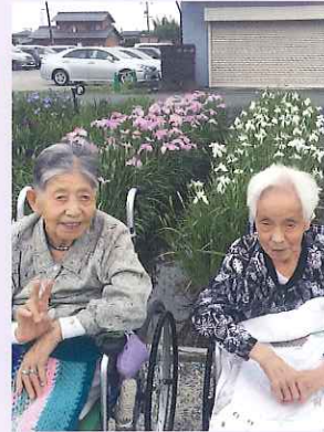
▲ 見事な菖蒲の花と記念撮影