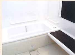
▲ 1人用風呂(ベンチシートで楽々浴槽移動)