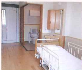
▲トイレ、エアコン、ベッド、洗面台、収納棚完備

使い慣れた家具や小物を 自由に持ち込んで頂くこと ができます。 ご自分の生活スタイルに あった居住空間を、つくり だしてください。