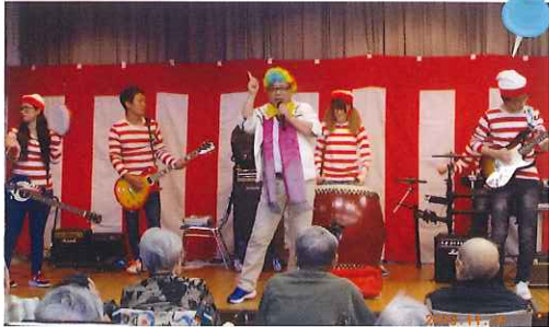
趣味を生かしたかくし芸大会!