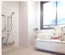
▲座って入れる浴槽