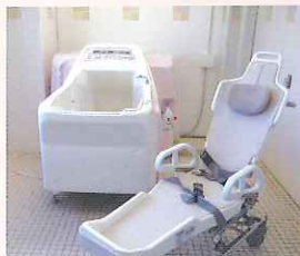
▲立位が困難な方が安心して入れる浴槽