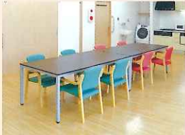
▲ わいわいガヤガヤ集いの場所

「みんなに愛され、みんなが集う拠点」づくりを目指します。小規模施設の特徴を生かし、親しみあふれる笑顔の絶えない施設です。