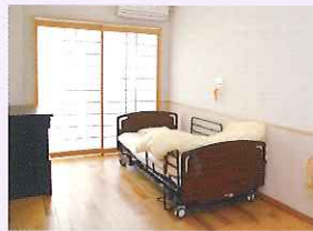
▲ エアコン、ベッド、洗面台、タンス完備

いぶき苑別館1階にあり、垂井町の要介護者の方を対象とする施設です。何十年もの長い間、同じ環境で暮らしてきた方が自宅で暮らしていた時のように、地域や人とのつながりを大切に、穏やかに暮らしていただけるようサポートいたします。