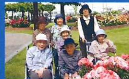
小規模デイサービス ほかほかいぶきオープン