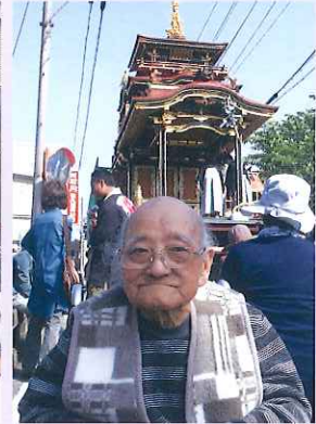
▲ 地元の祭りへ出かけました

いぶき苑別館1階にあり、垂井町の要介護者の方を対象とする施設です。何十年もの長い間、同じ環境で暮らしてきた方が自宅で暮らしていた時のように、地域や人とのつながりを大切に、穏やかに暮らしていただけるようサポートいたします。