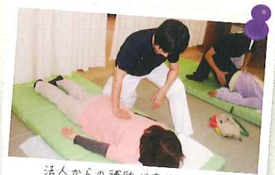
法人からの補助があり、カイロ アロマティックが他額で受けられます!