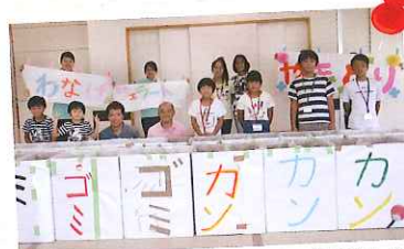
職場体験イベントとして、親の働く姿を子どもに見せる「子ども参観日」を実施しました!

2~3年程度の先輩が、マンツーマンで教育担当となり、業務上の疑問、困っていること、悩み、プライベートな事も含め、ありのままの相談をすることができます。