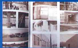
入所定員100名に増築