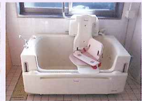
▲ 座って入れる浴槽