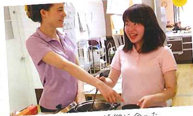
一人ひとりの特徴に合った 指導を受けられます。