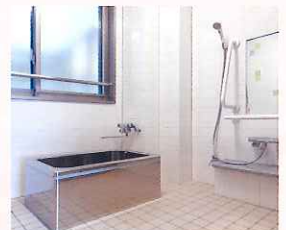
▲安心して入れる個室浴槽