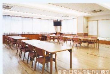
食堂・日常生活動作訓練室

デイサービスでありながら ADL 維持等加算の算定も認められるほど、リハビリにも力を入れています。お元気な状態で自宅生活を長く続けてもらう事を目標としています。