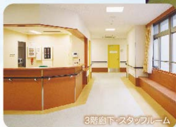
3階廊下・スタッフルーム