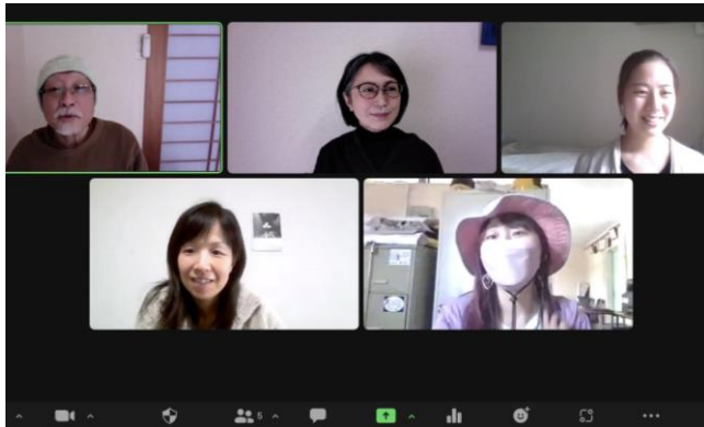
オンラインでの国内コンサルテーション

CP団体向けの研修以外では、PLASスタッフ向け国内コンサルテーションでは、PLASのケニア事業担当者がムラのミライ主催講座やフィールド研修（鳥取県 2020年2月）に参加したり、定期的にオンラインでの事業開始前の実情把握のための調査準備などの支援を行いました。