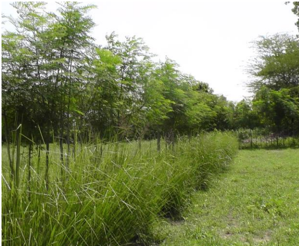
モデル農場：風よけとなるモリンガ（左の背の高い植物）と土壌流失防止となるベチベル草（手前の背の低い植物）を組み合わせ植えた栽培区画