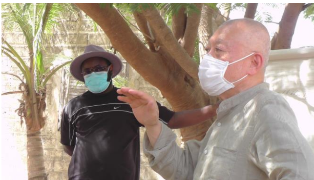
これまで習って実践したことを農民に質問（1年目）

1年目に作成した教科書を使い、水と土壌の保全、効果的な水やり、コンポストの作り方、作物の組み合わせ方、そして作業コストの計算とバランスシートに関する指導員養成研修を開始します。指導員が、教科書やモデル農場での実演を通して、これらの知識や実践を総合的に理解し、自分の言葉で人に伝えられるようになることを目指します。