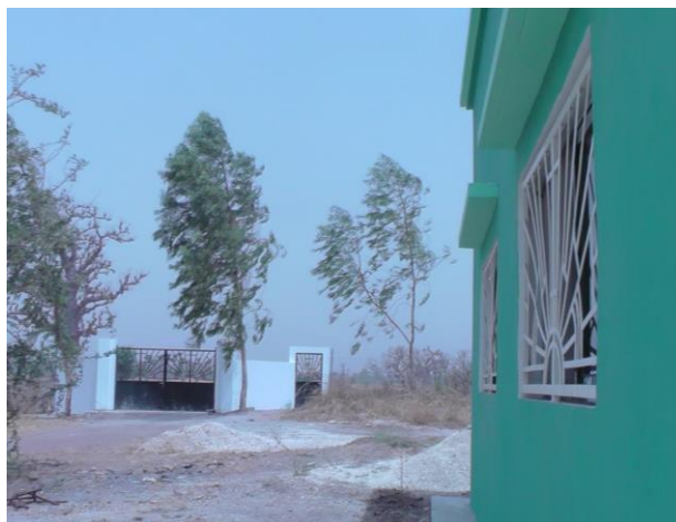
モデル農場：門（奥）と、遠方から研修に来る研修生が泊まれる宿舎（手前）