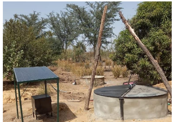
モデル農場：持続可能な資源利用を目指してソーラーポンプと井戸を設置