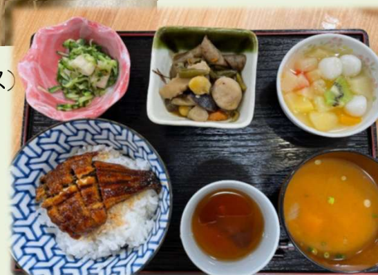
あんきの家の食事