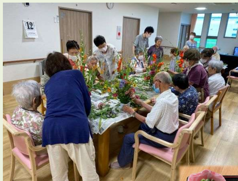
リビングの様子 (食堂・居間スペース)