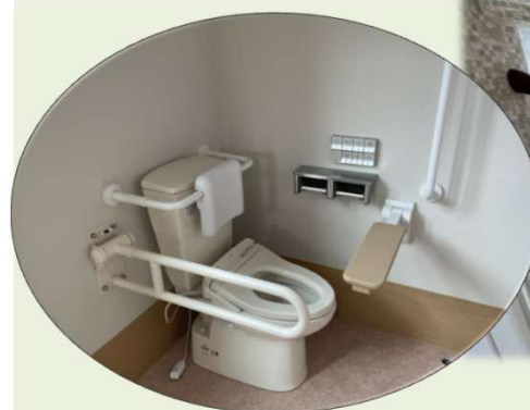
利用者様用トイレ