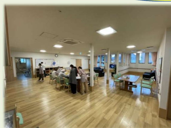
リビングの様子（食堂・居間スペース） あんきの家の食事（配食も一緒です）