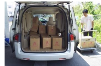
読谷村指定ごみ袋納品