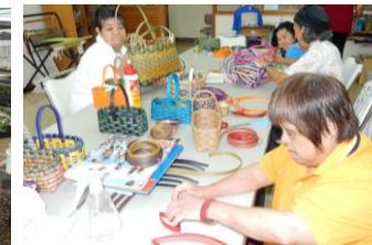
クラフトバック作り