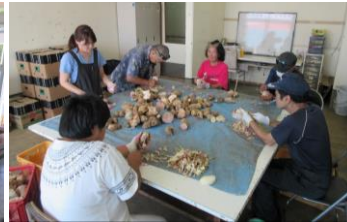
読谷いもの皮むき