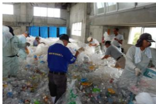
ペットボトル作業