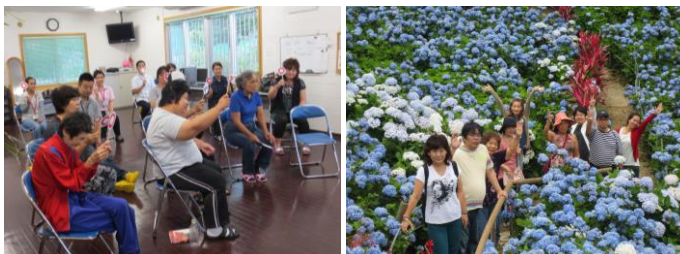
レクリエーション

北谷町上勢頭837-1 【TEL】926-3500 【FAX】926-3513 平成20年1月16日開所 4月1日経営受託 定員30人 (送迎あり)