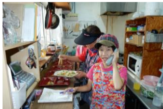
パーラーぱくぱく 定員7人(送迎あり)