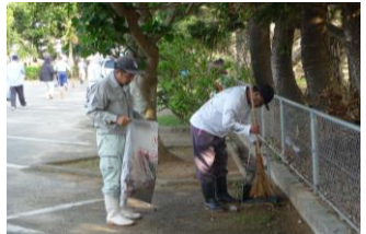
運動広場清掃 ＜生活介護事業＞