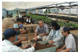
花の苗の植え付け