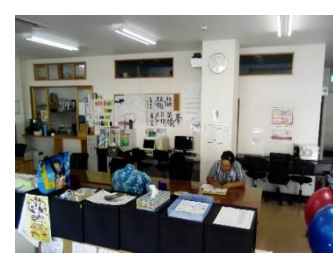
座学(パソコン、漢字、算数他)