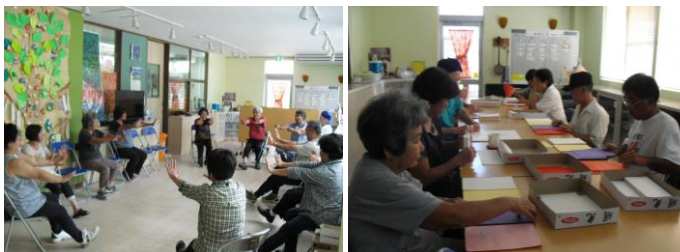
レクリエーション

読谷村字長浜1542 【TEL】958-7786 【FAX】989-6428 平成18年10月1日開所、経営受託 定員20人 (送迎あり)