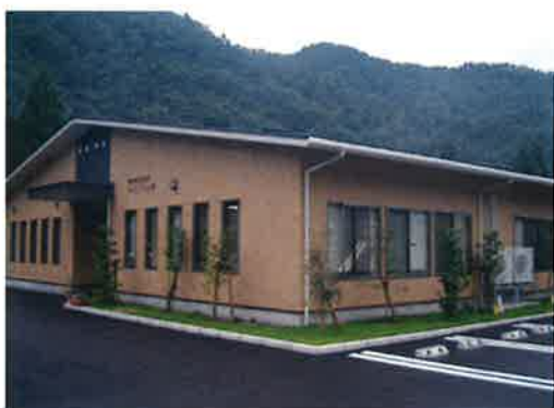
《友愛会 法人本部 事務局》