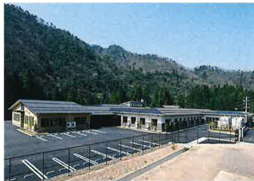
《障害者支援施設・短期入所事業 やすらぎの郷》