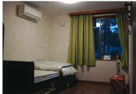
《指定共同生活援助事業 グループホーム ホープ》