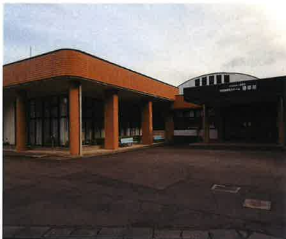
《特別養護老人ホーム 楊梅苑・老人短期入所事業》