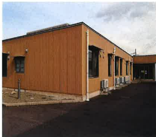
《ユニット型地域密着型介護老人福祉施設》