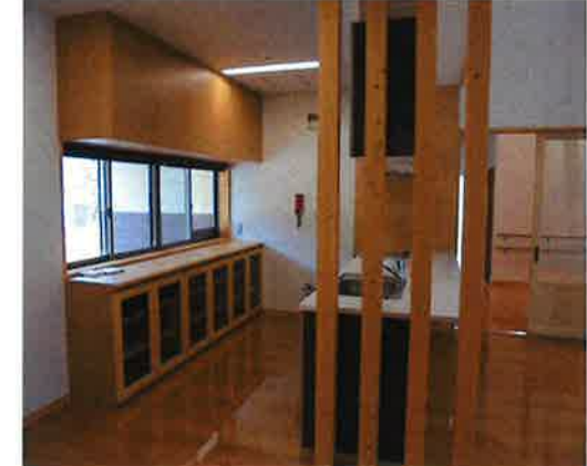
《指定共同生活援助事業 グループホーム ポルト》