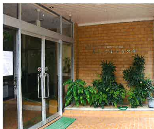
《障害者支援施設併設障害児入所施設 第二やすらぎの郷》