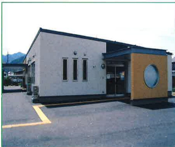
《多機能型就労移行事業所 おおいワークセンター》