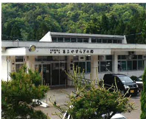
《障害者支援施設 第三やすらぎの郷》