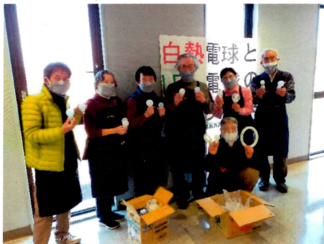
青谷会場のスタッフ一同

コロナ感染予防としてグループ分けを行い、交換前にLEDのしくみや再エネ・省エネのミニ学習会を行いました。また、イベントのお知らせ方法として初めて料金受取人払ハガキ付きチラシの全戸配布を行いました。青谷地域での配布枚数は1916枚、受取人払ハガキによる申し込みは56通、2.9%の返信率でした。他の地域では新聞折り込み（500枚）を行いました。こちらは2通、0.4%となっています。広報紙以外に地元のマスコミにも記事の掲載で協力を頂きました。どのようにお知らせをするか、どの時期で行うかなどこの分野はまだ検討の余地を残しています。