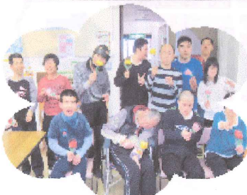
綺麗なお花作り！ 豆もぎの様子