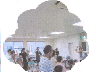
音楽療法でリラックス！