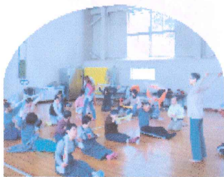
タオル体操でリフレッシュ！