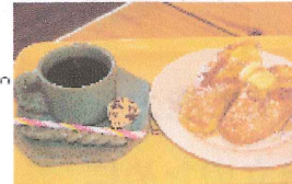
パンセット 500円 カレーセット 650円