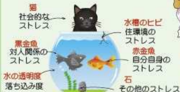
本人モード 結果画面 (例)

ストレス度・落ち込み度が分かります。ご本人の健康状態や人間関係、住環境などのストレス度や落ち込み度が、水槽の中で泳ぐ金魚などの船になって表示されます。