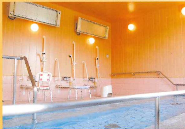
浴室 広く開放的でありながら安全に入浴いただけます。