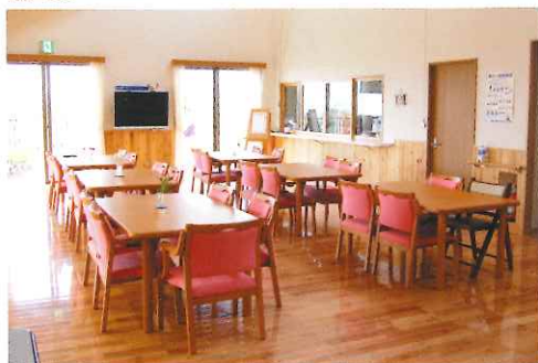
季節に応じた食材で楽しめる食事を提供します。