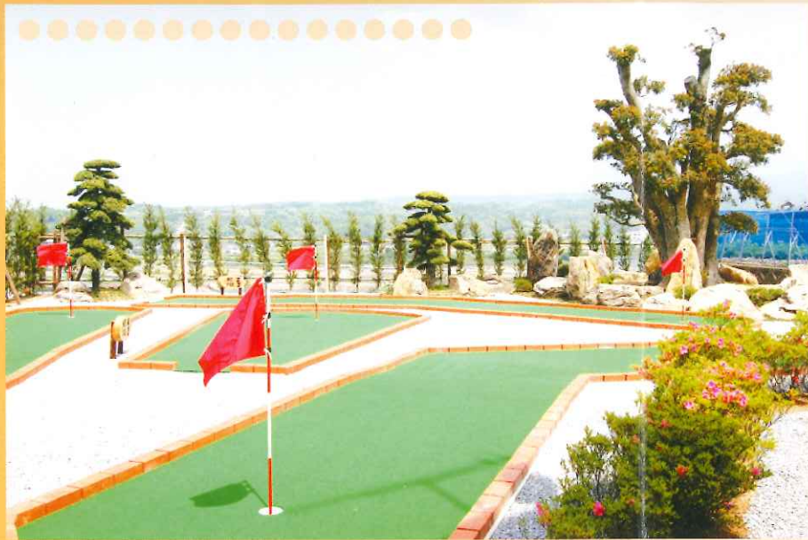
パットゴルフ 海と山を見ながらのパットゴルフは気分爽快です。誰でも楽しい心身機能の向上が大きく期待できます。