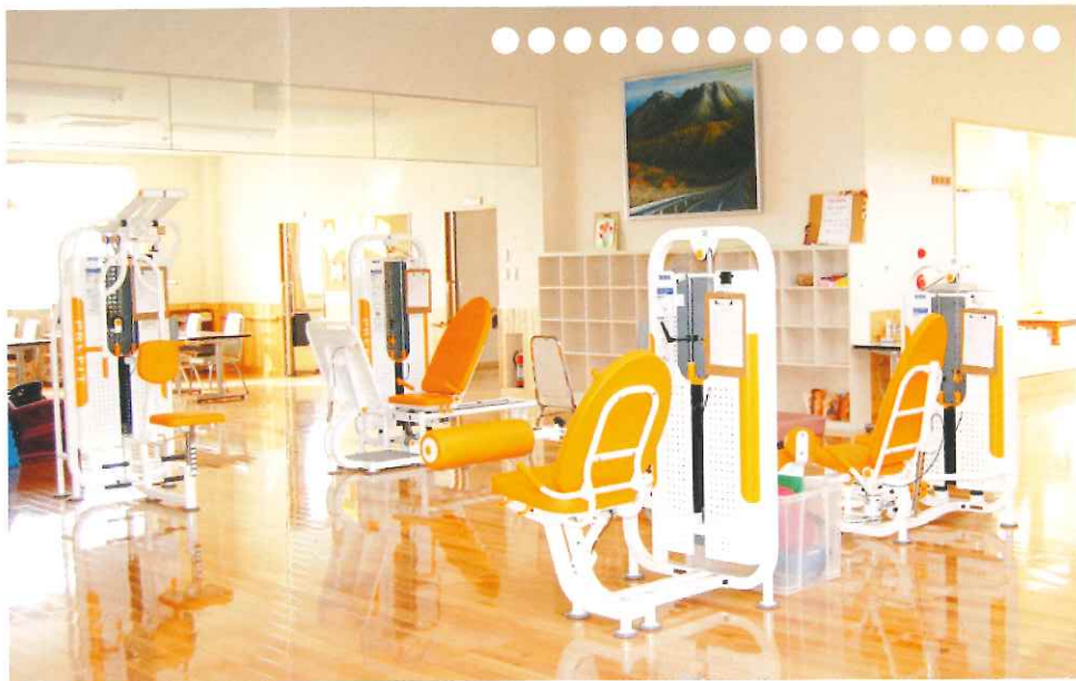
運動器機能訓練室

ご利用者とご家族が住み慣れた地域で いつまでも生き生きと 自分らしい生活を送れますように 支援していきたいと考えています。