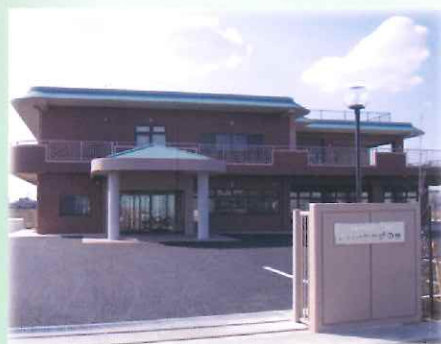
こしがや希望の里外観