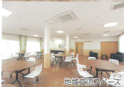
地域交流スペース