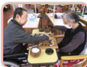
趣味活動・お楽しみ

体操・音楽・趣味などの活動や、食事・入浴などの日常生活上の支援を提供します。心身機能の維持・向上を図り、皆様の個性に合わせて生活の活性化を図ります。