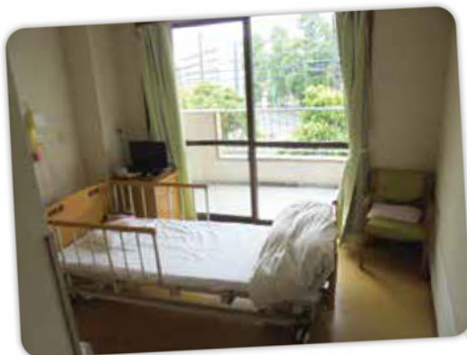
居室は“個室”“2人室”“4人室” があります。

在宅での生活が困難になった高齢者の方が、生活全般に関する介護を受けながら生活をする施設です。四季折々の行事の開催や、それにまつわる食事食の提供、歌や生花など趣味活動に力を入れ、潤いのある生活を提供していきます。希望される方には看取り介護も提供しています。