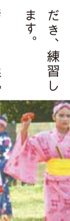
※ノロとは、沖縄県と鹿児島県奄美群島の琉球文化における女司歌のこと