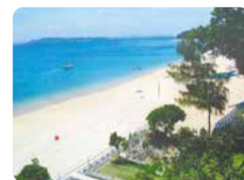
トマイ浜(津堅ビーチ)