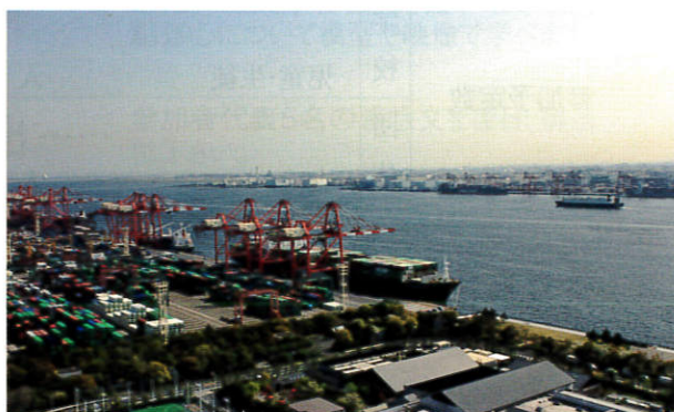
▲東京みなと館からの景色