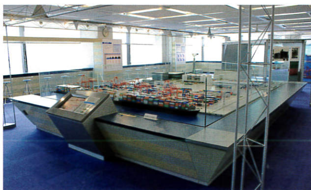
▲東京みなと館の館内