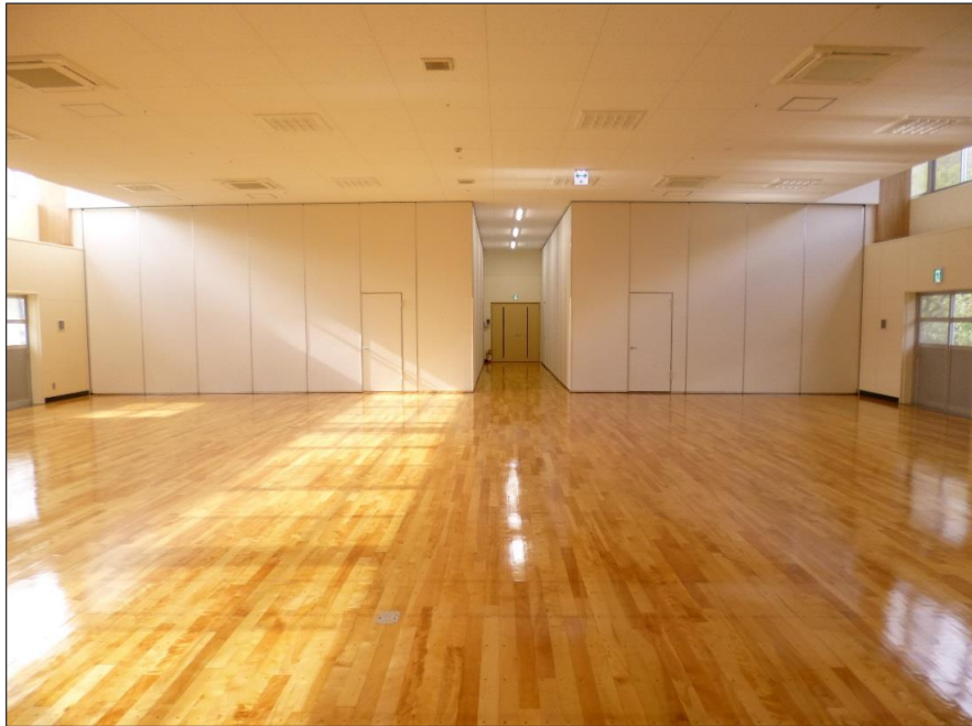
写真-大分類:完成写真 写真区分:体育室 1