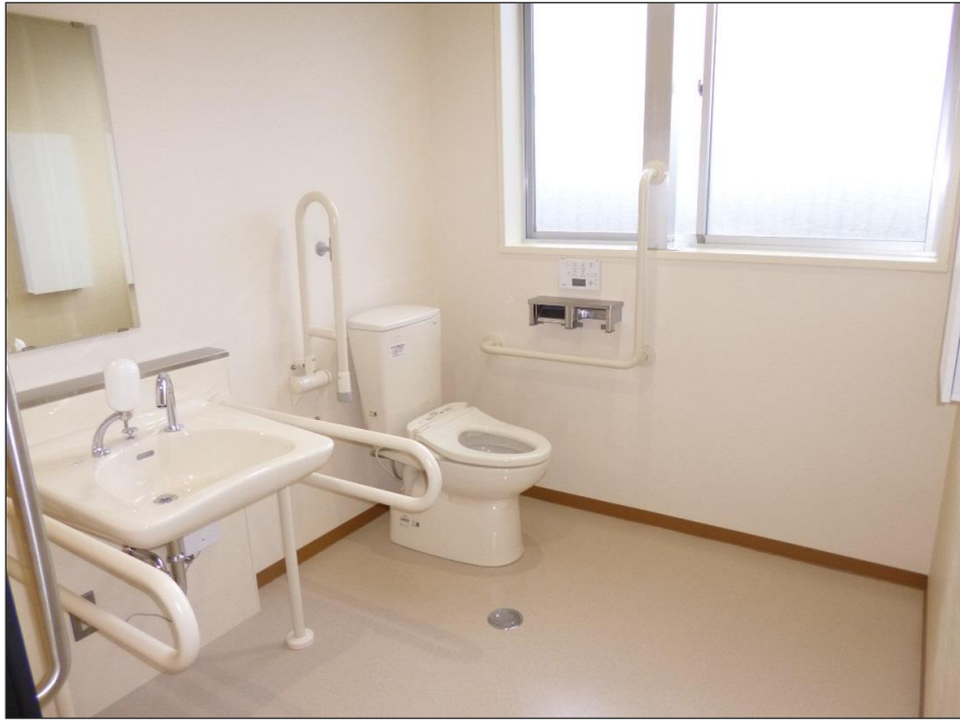
写真-大分類:完成写真