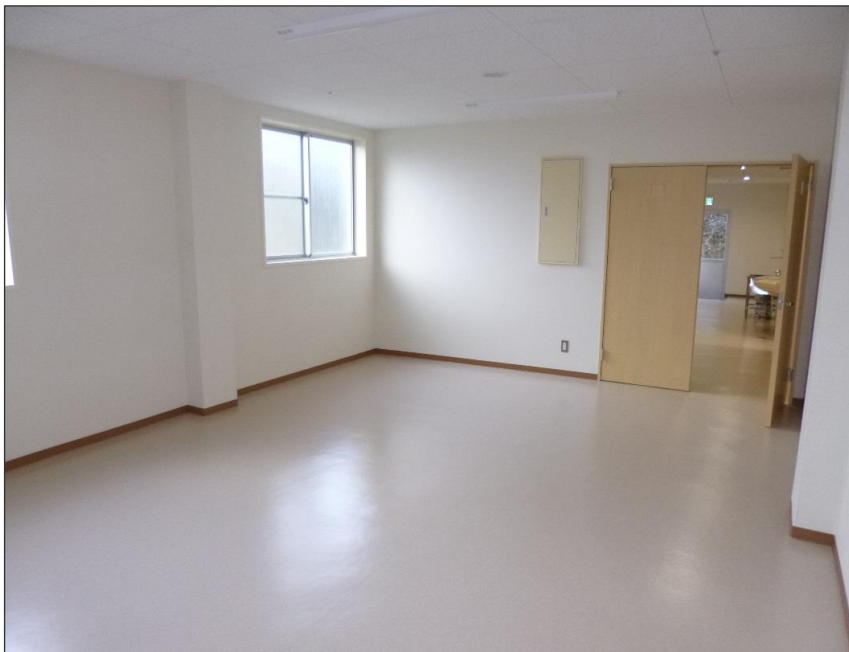
写真-大分類: 完成写真 写真区分: 倉庫