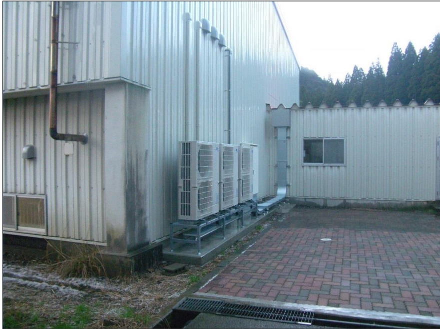
写真-大分類:完成写真 写真区分:空調設備室外機