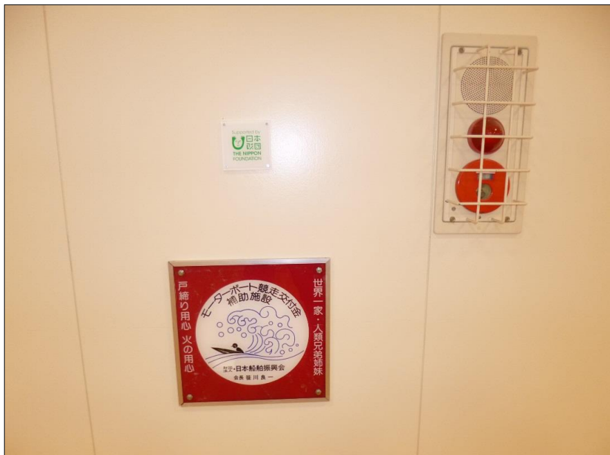
写真-大分類:完成写真 写真区分:日本財団表示板