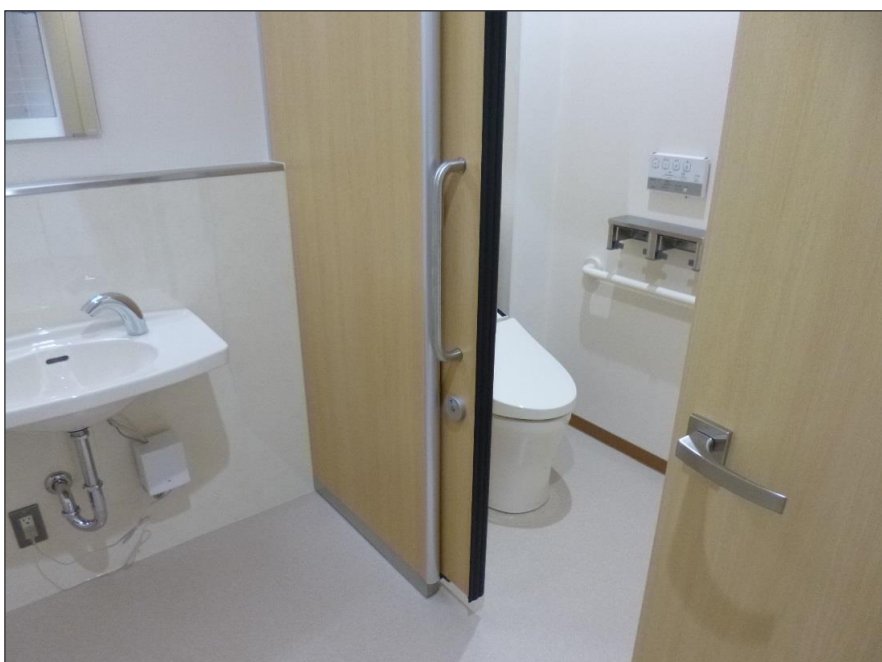
写真-大分類:完成写真