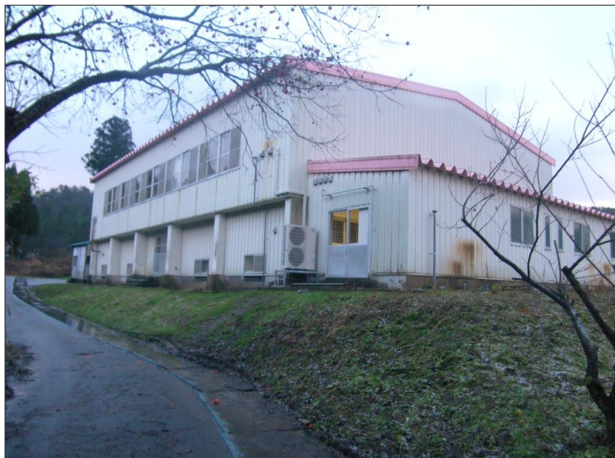
写真-大分類:完成写真