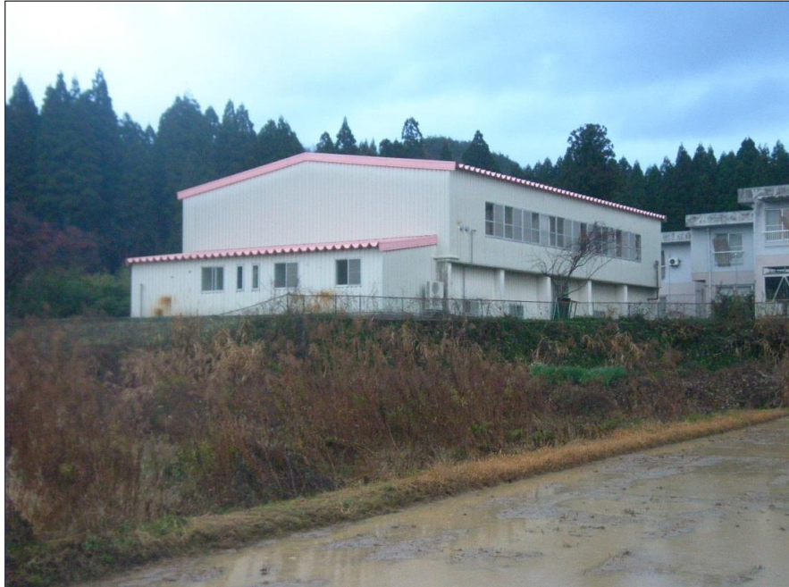
写真-大分類:完成写真