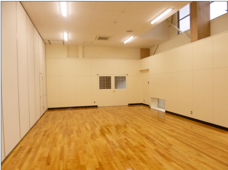
写真-大分類:完成写真 写真区分:体育室 3