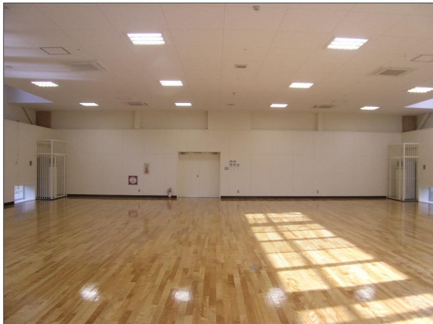
写真-大分類:完成写真 写真区分:体育室 1