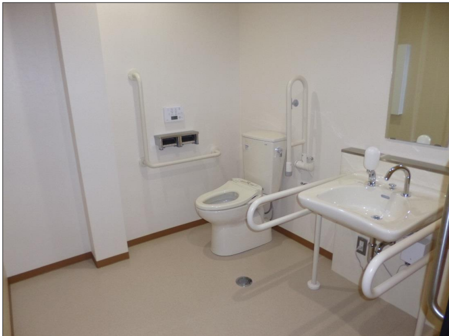
写真-大分類:完成写真