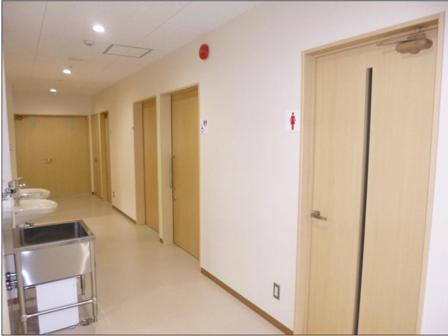
写真-大分類: 完成写真 写真区分: 廊下