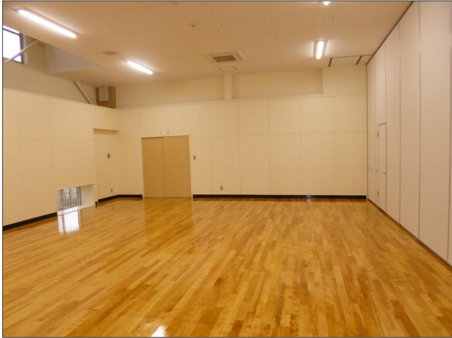
写真-大分類:完成写真 写真区分:体育室 2