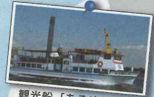
観光船「あるめりあ」

問い合わせ ①千葉港振興協会 ☎246-5201 ☎238-0648 ②③海の月間活性化委員会 ☎248-1153 ☎247-4873