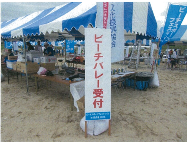
ビーチバレー受付テント