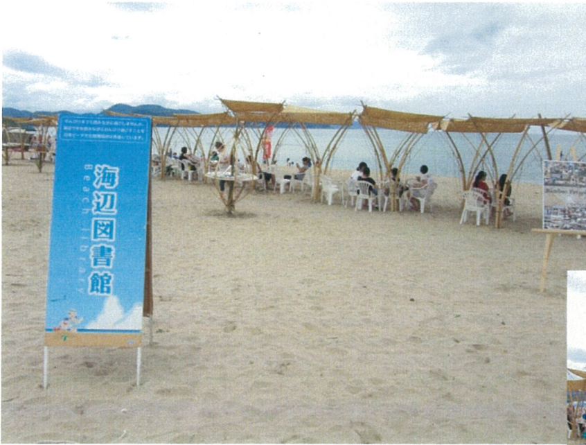
竹を活用した日除け。風にゆらゆら揺られるパーゴラで癒しの空間を演出 多くの方が竹のパーゴラの下でくつろいでいました