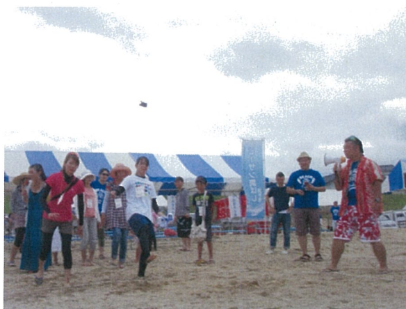
大人も夢中になって楽しんでいました