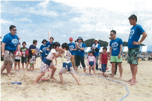
子どもたちも負けなように踏ん張ります