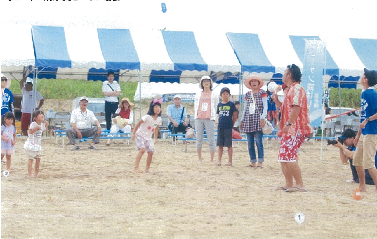
勢いよく足を振りかぶってビーサンを跳ばします