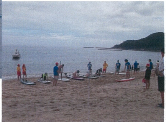
浜辺で講師から説明を受けます