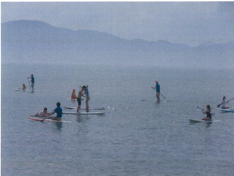
人気のスタンドアップパドルボードを多くの方が体験