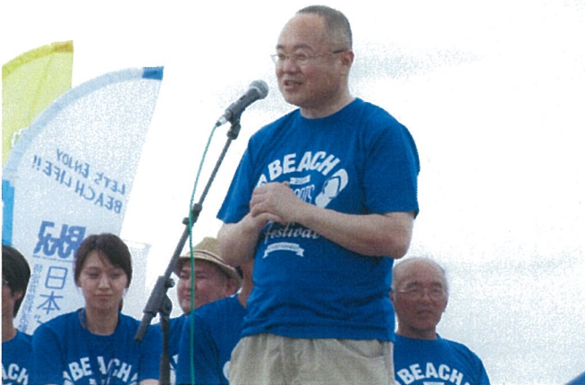
京丹後市長 中山 泰 様