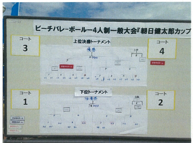
トーナメント表掲示ボード