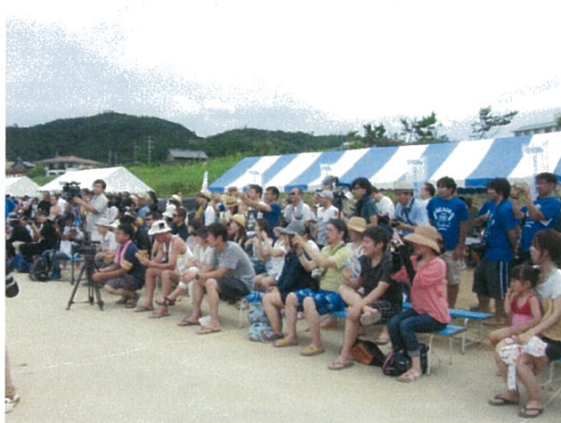
トークショーには多くの方が集まりました