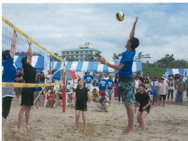
エキシビジョンマッチ