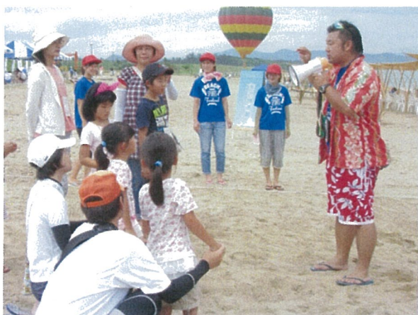
ビーサン協会のガンちゃんによる競技説明