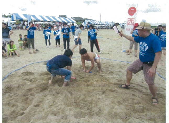
行司役は協会スタッフ 見合って見合って～