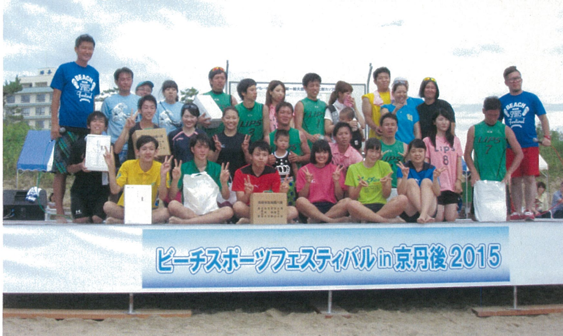
表彰式 入賞チームと記念撮影