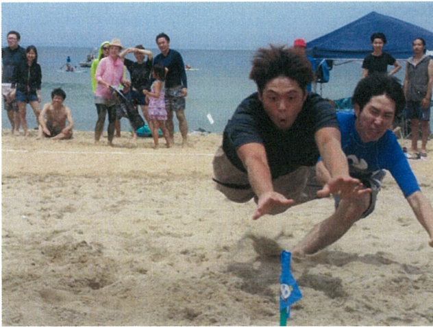
ホースに向かってダイブ！