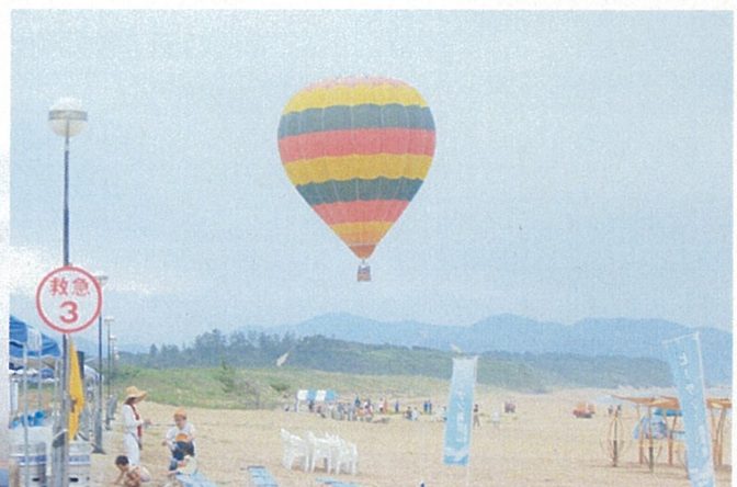
風の穏やかな午前中に開催。朝早くから多くの方が 列を作り、ロングビーチを空から一望しました