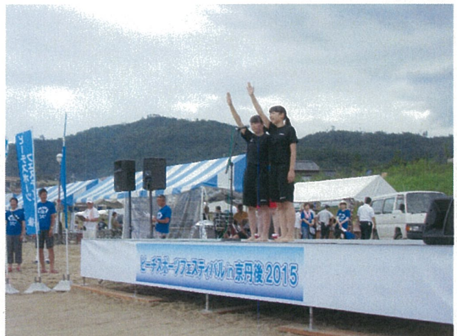
地元の高校バレー部の方による選手宣誓