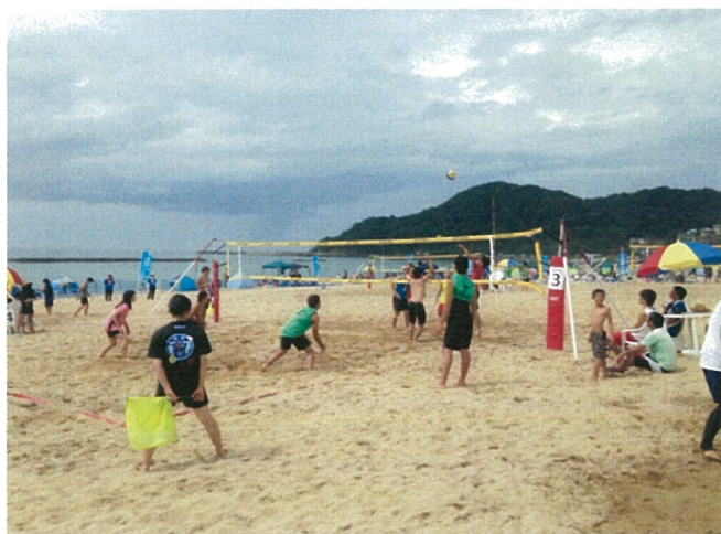
27チーム142名の参加者で熱い戦いが繰り広げられました